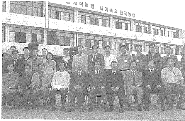
축산기술연구소 생명공학연구실의 가족들

새롭이 2세의 젖 1l에서 추출할 수 있는 EPO유전자는 0.1g 정도. EPO 유전자의 1g당 가격이 67만달러(약 7억3천만원)로 비싸기 때문에 새롭이는 11억원짜리 슈퍼돼지라 불리기도 한다. 세계시장 규모 26억달러(약 2조8천6백억원)로 산업적 가치가 높은 EPO유전자는 신장세포에서 만들어지는 일종의 조혈 호르몬이다. EPO유전자는 적혈구의 형성을 조절하며 신장에 장애가 발생할 경우 합성이 중단돼 빈혈현상이 일어나기 때문에 거꾸로