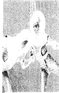
[사진22]미래성, André Courrèges, 패션발상트 레닝3 , p.16