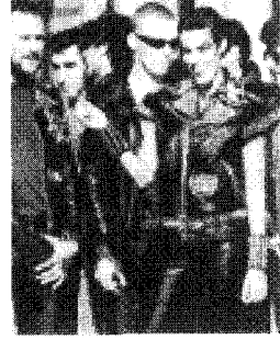
[사진30]저항성, Icons of Fashion 20th Century , p.87

장은 세계의 고부가가치 패션상품 생산국으로 거듭날 수 있었다. 위의 사례는 디자이너의 창의적 조형성이 한 나라의 패션계를 선진국으로 끌어올린 예라고 하겠다. 97~98 A/W 프레타포르테 컬렉션에 Versace, Armani, Gaultier의 대부분의 작품들은 금속소재를 실용적으로 접목시켜 시각적 집중성을 도입한 예이다.