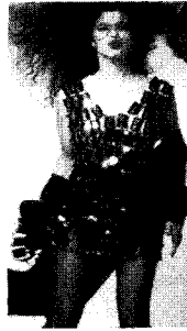
[사진3] 금속조각 앞책, p.19