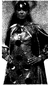
[사진2] 금속케이 패션디자인발상 트레닝3, p.18