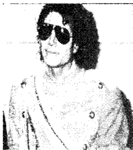
[사진 13] 80년대 금속패션 Fashion of a decade the 1980s, p.19

1989년부터 1999년까지의 10년간의 패션은 전세계적으로 국경이 무너지는 Global 시대로 평가된다. 29,30 1990년대 초반 정보 통신 분야의 눈부신 발전과 사이버 세계에 대한 막연한 동경 그리고 세기말의 불안과 미래 세계에 대한 기대감으로 전위적인 테크노/사이버펑크 스타일이 패션계의 화두가 되었다. 위의 스타일은 당시의 'Mad Max'와 'Blade Runner' 영화에서 공상과학에 나오는 주인공 같은 미래의 전사로 표현되곤 하였다. 특히, 그들의 패션 소재는 금속 소재가 우세하며 특수한 기능을 지닌 신소재가 대부분이다. 이러한 일련의 분위기에 편승하여 패션계를 리드하는 Thierry