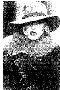
[사진 20] 90년대 금속 패션, The Fashion Book, p.439

Mugler나 Jean-Paul Gaultier와 같은 디자이너들의 작품이 테크노/사이버펑크 스타일로 발표되기도 하였다. [사진 17]은 95~96 A/W에 발표된 것으로 금속소재를 주조의 형태로 제작하여 미래 로봇인간의 이미지를 표현하고 있으며, [사진 18]은 금속소재의 주방용품들로 디테일을 구성한 전위적인 'Cyberpunkish' style이다. [사진 19]는 1993년 혼돈의 상징인 Technoheads를 한 Technoduo로 과장된 금속디테일이 보여지고 있다. [사진 20]은 1991년도 Anna Sui의 작품으로 금속성 sequins웨터와 털로 헐리웃 스타 그레타 가르보의 분위기를 연출하고 있다. 30)