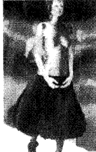
[사진27]전위성, Ibid , p.170