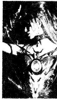
[사진32]저항성 Thierry Mugler, p.59