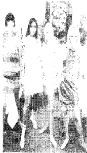
[사진 7] 60년대 금속패션, Fashions of a decade: The 1960s , p.63