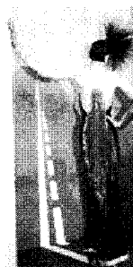
[사진 15] 80년대 금속 패션, Icons of Fashion 20th Century, P.129