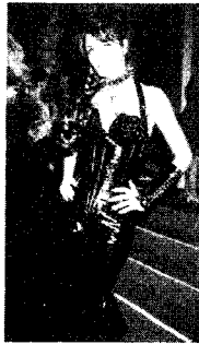
[사진31]저항성 Fetish, p. 126