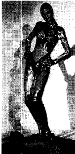
[사진 17] 90년대 금속패션, Thierry Mugler, 95-96 A/W, P.49