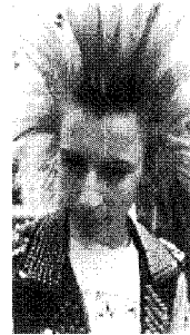
[사진 12] 70년대 금속패션, Op. cit. , p.56

인 소재로 street에서도 입을 수 있는 의상으로 제작되어졌으며 당시의 space-age 패션을 주도했던 패션 디자이너로는 Pierre Cardin, André Courrèges, Rudi Gernreich, Yves Saint Laurent를 들 수 있다.