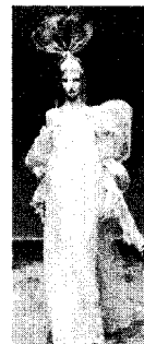
[사진35]고귀성, Icons of Fashion 20th Century, p.142