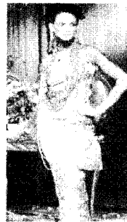
[사진34]고귀성 98 S/S Collection p.47