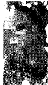
[사진 11] 70년대 금속패션, 'Punk' Style Surfing , p.56