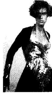
[사진4] 금속조각 앞책, p.20