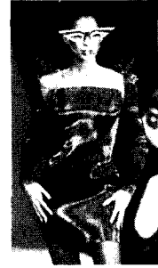
[사진6] 금속막 앞책, p.10