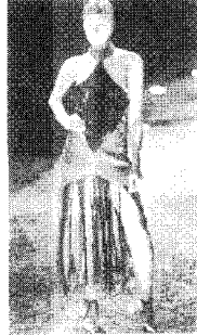
[사진28]전위성, 98-99 A/W, Collections , p.268