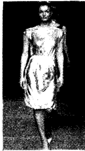
[사진1] 금속섬유 Collection, '98 S/S, p.267