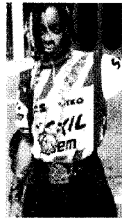
[사진33]저항성, Icons of Fashion 20th Century, p.165