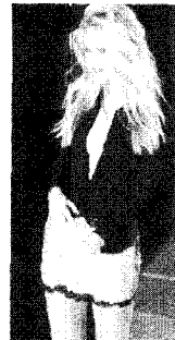
[사진25]집중성, Gianni Versace, 98-99 Collection , p.134

주 록과 여기에 반 전통적 정신과 과학주위적 실험성, 기계주의의 비인간성을 내포하는 아방가르드 룩(Avantgard look), 1990년대 접어들면서 퍼스날 컴퓨터(personal computer) 보급의 급증과 인터넷 사용의 확대는 가상 현실(virtual reality) 세계를 표현하는 사이버 룩 37) 으로 나타나고 있다. 사이버 룩에 사용되는 소재는 금속성 원단 이외에도 첨단 테크놀로지 감각을 도입한 다채로운 신소재가 등장하고 있다. 38)