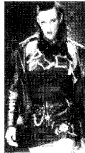
[사진 10] 70년대 금속패션, 'Punk' Icons of Fashion 20th Century , p.121