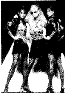
[사진26]집중성, Icons of Fashion 20th Century , p.142