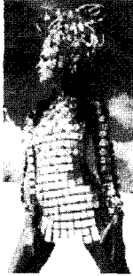
[사진21]미래성, Paco Rabanne, The Fashion Book , p.383