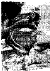
[사진 14] 80년대 금속 패션, The Fashion Book, p.282