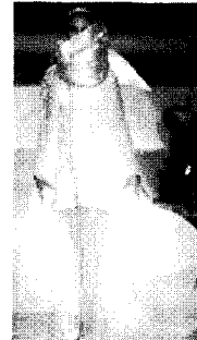
[사진24]집중성, Claude Montana, Ibid , p.155