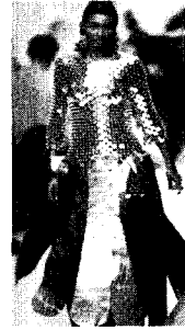
[사진5] 금속판 앞책, p.20