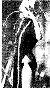
[사진 18] 90년대 금속 패션, Street style, p.125