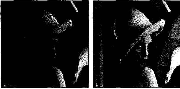
(그림 3) Lena 원영상 (그림 4) 워터마킹된 Lena 영상