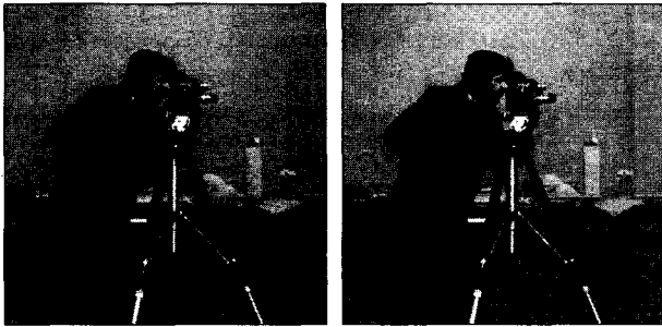
(그림 5) Cameraman 원영상 (그림 6) 워터마킹된 Cameraman 영상