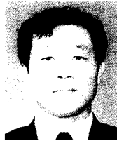
남청도 C-D Nam