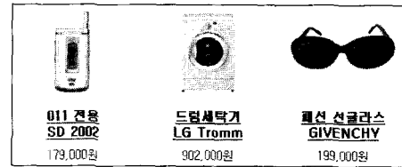
(그림 2) 웹 이미지와 링크된 관련 텍스트 예

를 보여준다. 이와 같은 경우 해당 이미지는 '제거 가능' 클래스에 속할 수 있다.