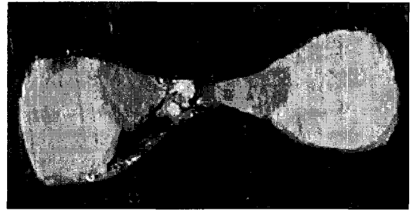
Fig. 1. Representative photograph of lateral condensation group at the level 1(1mm from the apex ) Nonhomogeneous gutta-percha filling containing voids between the gutta-percha cones and the canal walls, as well as in isthmus