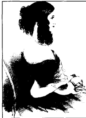
<도7> Cunnington, W., & Cunnington, P., A Picture History of English Costume, Vista Books, 111, 1960