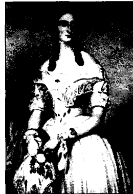
<도8> Cunnington, W., & Cunnington, P., A Picture History of English Costume, Vista Books, 113, 1960