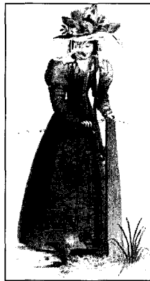
〈도2〉 Cunnington, W., & Cunnington, P., A Picture History of English Costume, Vista Books, 107, 1960.