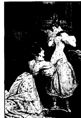
<도10> Waugh, N., Corsets and Crinolins, B.T. Batsford Ltd, 138, 1954, 도105.