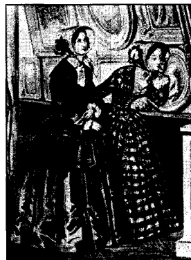
<도9> Laver, J., Costume & Fashion, Houghton Mifflin Company, 171, 1969, 도191