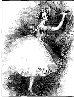
〈도3〉 Squire, G., Dress Art and Society, The Viking Press, 150, 1974.