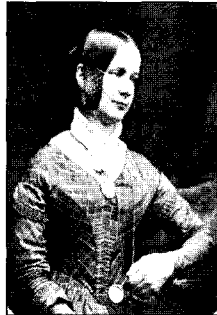
〈도4〉 Gernsheim, A., Victorian & Edwardian Fashion, Dover Publications, Inc., 41, 1963, 도 16.