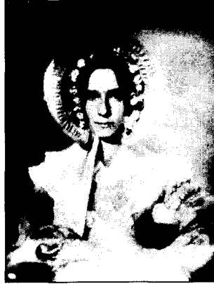
<도6> Gernsheim, A., Victorian & Edwardian Fashion, Dover Publications, Inc., 34, 1963, 도3.