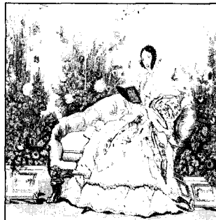
〈도5〉 Laver, J., Costume & Fashion, Houghton Mifflin Company, 166, 1969, 도 187.