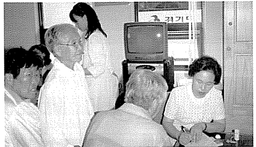
▲ 경기지부는 이천 하나원노인시설에서 노인 83여명에게 무료건강검진을 실시했다.