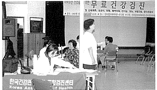
▲ 대구지부는 청곡사회복지관에서 일반시민 119여명에게 무료건강검진을 실시했다.