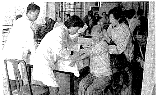
▲ 전북지부는 전주 소망요양원 43여명에게 무료건강검진을 실시했다.