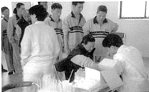
▲ 대전충남지부는 정신지체장애인 수양원에서 203여명에게 무료건강검진을 실시했다.