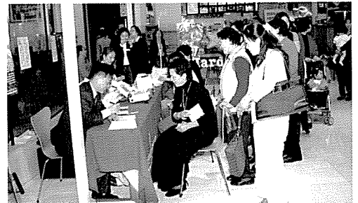
▲ 광주전남지부는 광주 신세계백화점에서 일반주민 731명에게 무료건강검진을 실시했다.