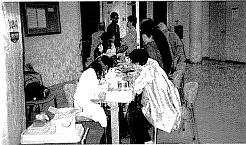
▲ 서울지부는 마포 노인종합사회복지관에서 160여명에게 무료건강검진을 실시했다.