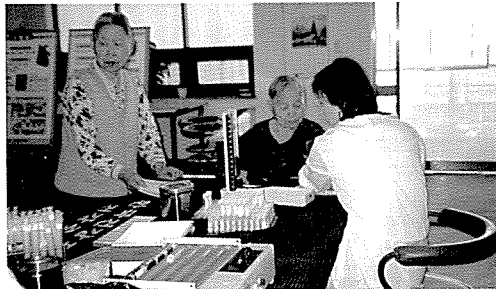
▲ 인천지부는 내리요양원에서 50여명에게 무료건강검진을 실시했다.