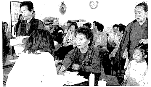
▲ 충북지부는 청주 종합사회복지관에서 60여명에게 무료건강검진을 실시했다.