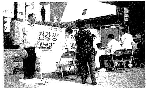
▲ 경남지부는 마산 대우백화점에서 일반주민 360여명에게 무료건강검진을 실시했다.