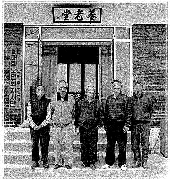
▲ 안하마을의 노인정에서는 나이 지긋한 분들이 모여 마을의 중요한 일들을 결정한다.