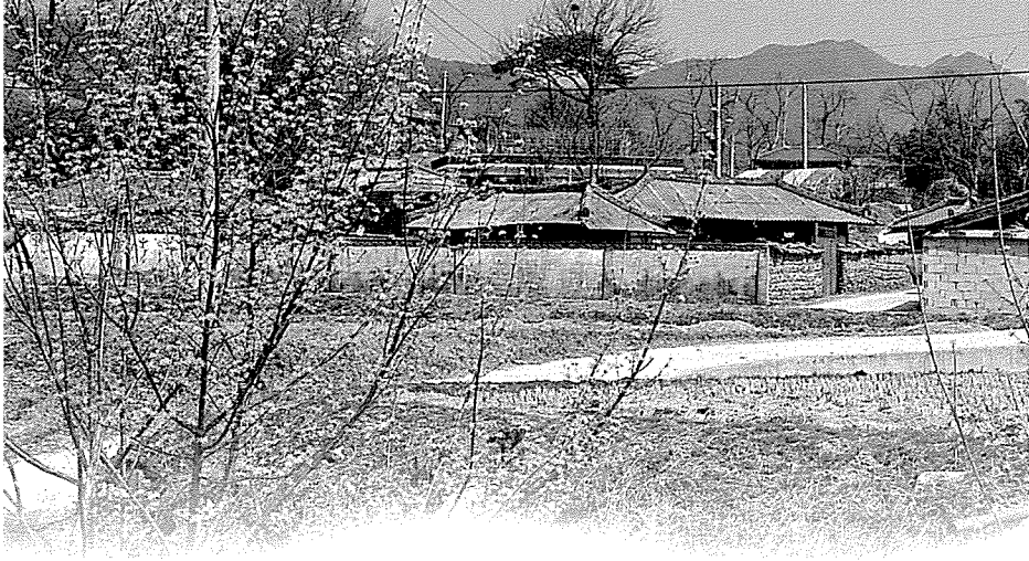
◀ 산과 들로 둘러싸인 안하마을은 맑은 공기와 깨끗한 물을 자랑한다.