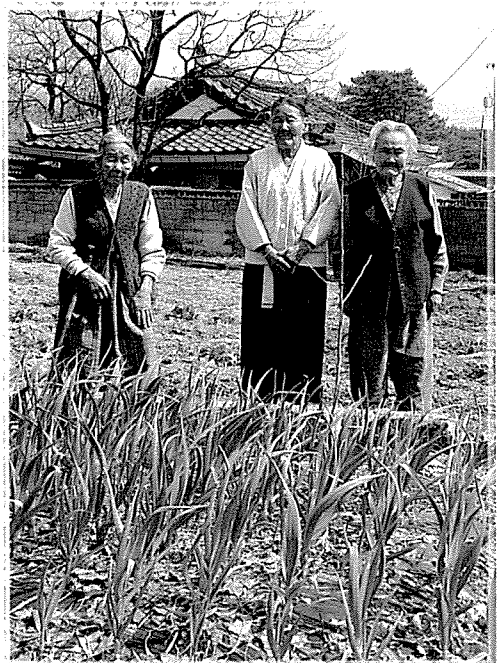
▲ 장수촌 주민 중에는 욕심을 버리고 자연의 순리대로 살아가는 사람이 많다.

체형은 비만보다는 마른 형이, 치아가 튼튼한 사람일수록 더 오래 산다. 지압이나 손발 마찰, 등산 등 간단한 운동을 하는 사람이 있지만 건강을 위해 특별히 노력하는 것이 없는 것도 안허마을을 포함한 전국의 장수촌의 공통된 현상이다. 7