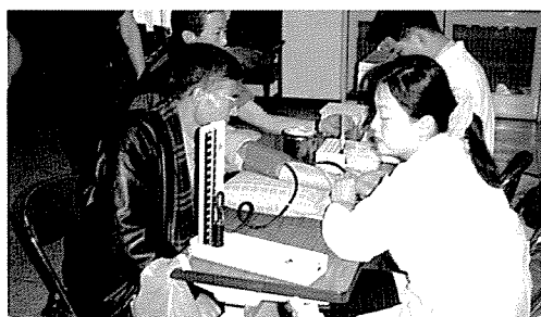
▲ 서울지부는 강서구관내 기초생활수급권자 60여명에게 무료건강검진을 실시했다.