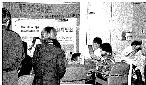
▲ 대구지부는 한국가루프에서 일반시민 30여명에게 무료건강검진을 실시했다.