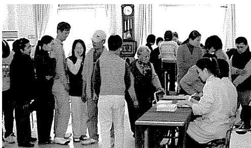
▲ 광주·전남지부는 곡성삼강원, 엠마우스, 귀일요양원, 성빈여사, 용진원, 무등육아원 등 원생 940여명에게 무료건강검진을 실시했다.