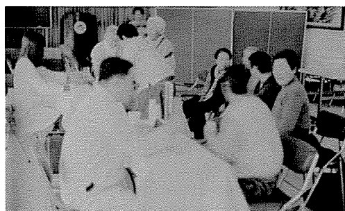
▲ 울산지부는 노인복지시설인 남구노인복지회관에서 노인 70여명에게 무료건강검진을 실시했다.