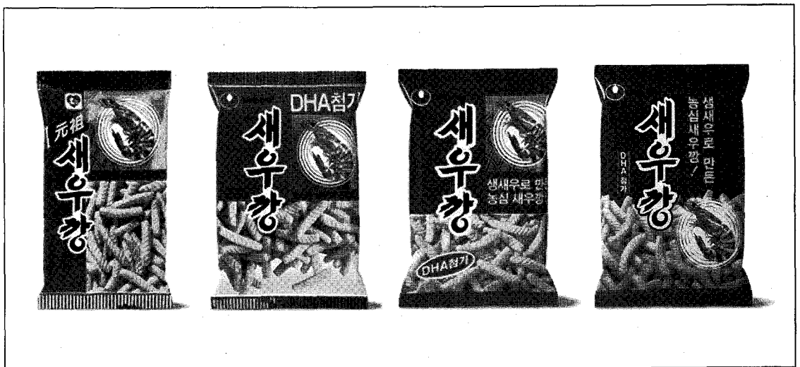
▲ 80년대 다양한 포장변천을 이룬 새우깡

인쇄기술의 발달로 디테일을 살릴 수 있게 되자 어색했던 새우그림이 생생한 새우 사진으로 대체되면서 더 먹음직스러운 느낌을 불투명 패키지로 연출했다. 그러나 투명에서 불투명으로 바꾼 뒤 소비자