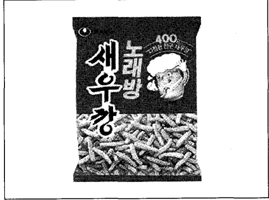
▲ 새우깡의 대형화 '노래방 새우깡'

들이 투명 포장이 아닌 것은 다 이류제품으로 인식해서 불투명 포장의 농심 새우깡도 이류취급을 받았으나 한 달만에 매출이 정상궤도로 돌아왔다.