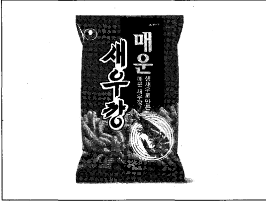
▲ 매운 맛을 첨가해 새롭게 시판한 '매운 새우깡'