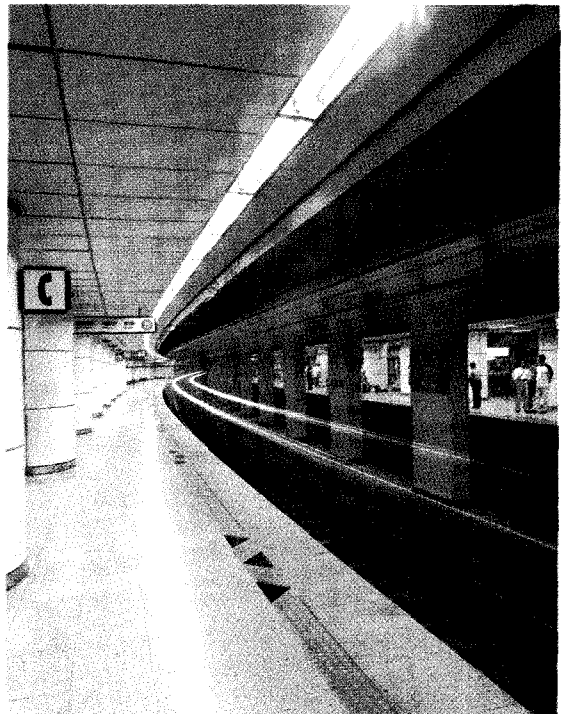
서울 지하철 발산역(5호선)

이와 같은 성원상떼빌의 연이은 분양성공은 그 품질의 우수성과 마케팅 능력을 대내외적으로 인정받았으며, 성원은 향후에도 고품질 아파트의 대명사로서 그 위치를 더욱 발전시켜 나가기 위해 설계 및 마감자재 하나까지에도 세심한 정성을 기울이고 있다.