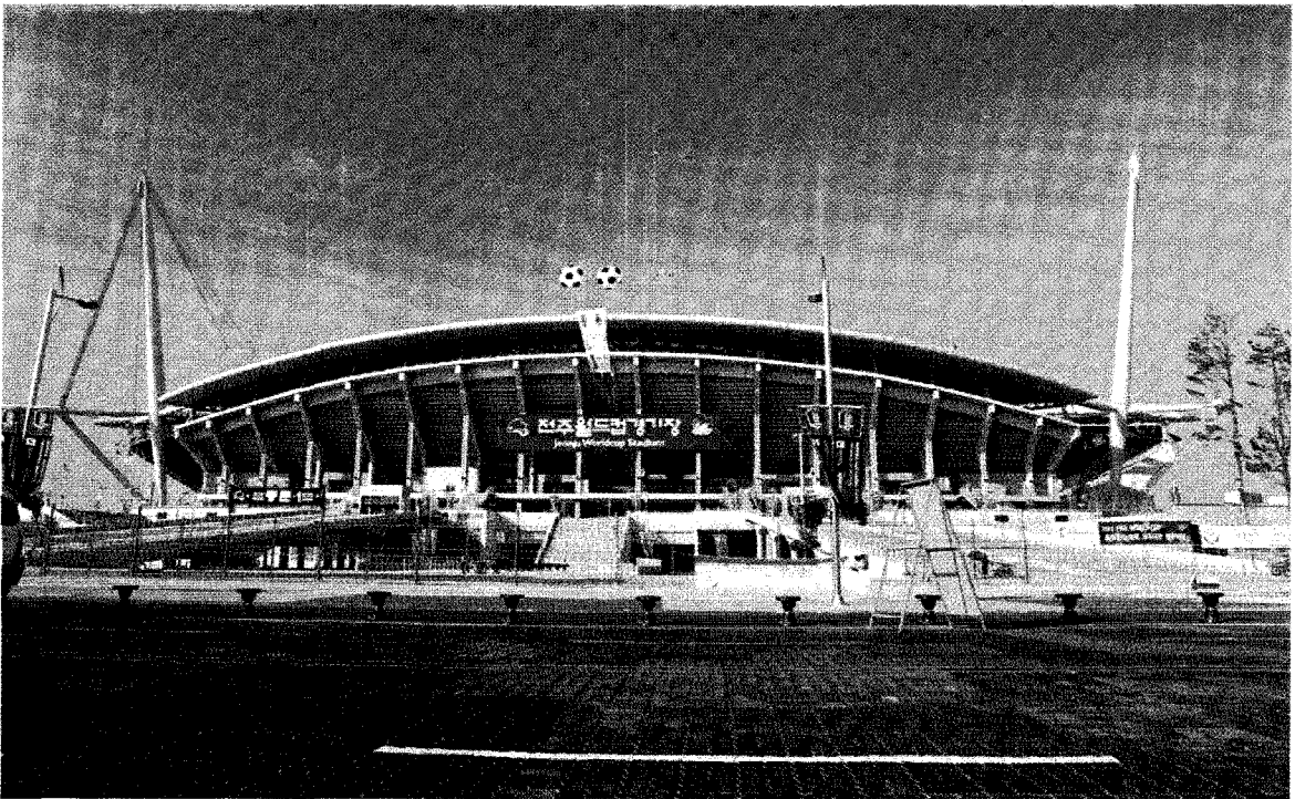
전주 월드컵 경기장

계열사인 성원건설은 2002년 전주월드컵 경기장을 건설함으로써 우수한 기술력을 대내·외에 과시하였다. 특히 이 경기장은 2002년 네티즌이 선정한 가장 아름다운 경기장으로 선정되어 설계에서 뛰어날 뿐만 아니라, 금년 6월에는 실제 경기를 진행할 때 장대같은 비가 순식간에 쏟아졌는데도 배수가 원활하게 이루어져 경기를 참관한 세계각국 축구인들로부터 찬사를 받았을 정도로 시공에서도 거의 완벽