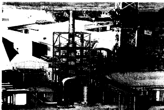
(a) 20 세기

1990년대 접어들면서 기후변화협약 등 국제적인 에너지사용규제에 대응하기 위하여 에너지절약, 청