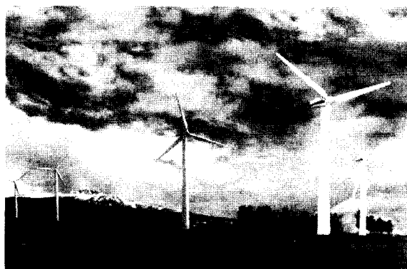
(b) 21 세기