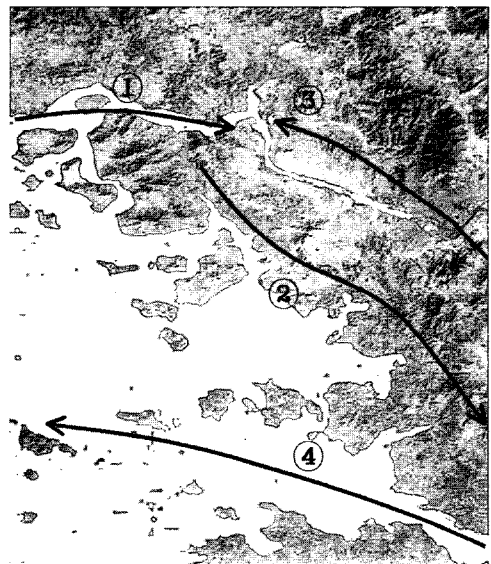
<그림> 삼국시대 경기만에서의 활동로

지에 도달하였다 한다. 韓地가 어디인지 분명하지 않지만 여러 가지 정황으로 보아 강화도일 가능성이 제일 높다. 즉, 졸본을 떠나 지금의 강화도에 도착하여 마니산에 올라 첨성단을 차려놓고 하늘에 제사지냈다는 것이다. 이때가 기원전 195년이므로 이로부터 177년이 지난 후 같은 해로를 따라 항해하는 것은 쉽게 이해할 수 있다. 지금까지 일반적으로 비정했던 내륙으로 남하는 그 가능성을 전적으로 지울 수는 없지만 혈혈단신도 아니고 따르는 많은 백성이 무리지어 당시 만해도 무시 못할 세력이었던 낙랑과 대방지역을 통과한다는 것은 쉬운 일이 아니다. 두번째 질문에 대한 답은 아무래도 비류백제에 대하여 가장 많은 글을 남긴 김성호씨의 주장에서 차용해 와야 할 것 같다 11) . 삼국사기에도 나타나 있듯이 비류의 아버지는 주몽이 아닌 優台 12) 로 그는 기원전 5세기에 句踐이 이끄는 越족에 쫓겨 요동까지 밀려 온 뒤틀족의 후예로 알려져 있다. 오족은 오래토록 양자강에서 살아 물길과 해운에 익숙한 키 작은 부족이다. 따라서 오족의 피를 받은 비류