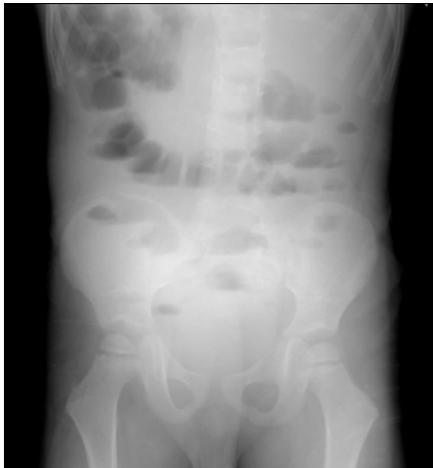
Fig. 1. Upright abdomen film with multiple air-fluid levels.

간헐적으로 복통 및 구토를 겪던 3세 남자 환자로 내원 4일 전부터 비루, 인후통 등의 증상 있어 외래