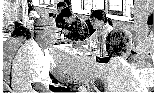
▲ 전북지부는 군산 월명중학교 외 4개교 등의 중식지원학생 및 일반주민, 기초생활보장수급권자 980여명에게 무료건강검진을 실시했다.