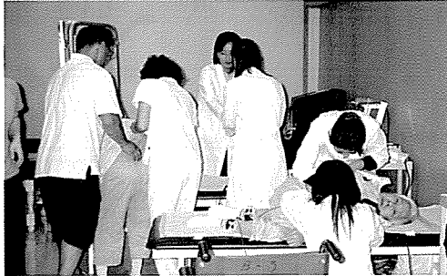
▲ 강원지부는 노인복지시설인 광림노인전문요양원, 원주상지여자중학교 등의 원생 및 중식지원학생, 일반주민 270여명에게 무료건강검진을 실시했다.