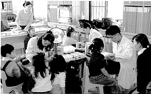
▲ 대구지부는 아동복지시설인 애활원 외 2곳, 노인복지시설인 안심제일복지관 외 1곳, 장애인복지시설인 청구재활원 등 원생 510여명에게 무료건강검진을 실시했다.