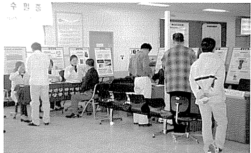
▲ 인천지부는 아동복지시설인 향진원 외 1곳, 인천면허시험장 등 원생 및 일반주민 260여명에게 무료건강검진을 실시했다.