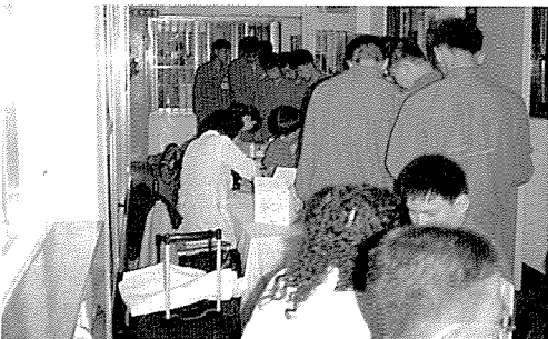
▲ 전북지부는 교도시설인 전주소년원 등 교도시설제조사 및 일반주민, 기초생활보장수급권자 460여명에게 무료건강검진을 실시했다.