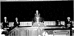
제1회 한국건강관리협회 학술대회 The 1st Academic Conference of KAMP