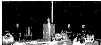
2002년도 학생 건강지도 관계자 연수회 일시: 2002. 12. 10(화)~10(수) 12:30~13:30 장소: 서울대학교 1호관 201호 회의실