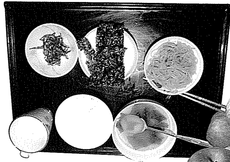
▲ 할머니는 멸치, 김, 사과같은 채식이나 해산물을 즐겨먹는다. 고기류는 거의 안먹는다.

할머니는 작년까지만 해도 잘 걷고 귀도 밝은 편이었는데 금년 들어 건강이 나빠졌다고 한다. 하지만 혼자 앉아서 식사를 하고 주변 사람과도 담소를 하는 모습을 보니 여전히 건강한 모습이었다. 흥미로운 것은 할머니께서 단 것을 유난히 좋아한다는 사실이다. 사탕은 물론 사카린까지 좋아해 젊어서는 국물에 설탕을 넣어 달게 한 후 밥과 같이 먹을 정도였다고 한다. 아무리 생각해도 이런 것은 장수와는 관련 없는 것 같다. 실제로 할머니는 치아가 하나도 없고 잇몸만으로 식사를 하는데 제리같이 부드러운 것은 싫어하고 쥐포나 말린 명태, 멸치 같이 약간 딱딱한 음식을 즐겨 드신다고 한다.