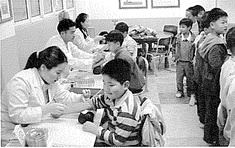
▲ 서울지부는 노인복지시설인 천사요양원, 장애인복지시설인 교남학교, 경서중학교 외 2개교 등의 원생 및 중식지원학생 270여명에게 무료건강검진을 실시했다.

한국건강관리협회는 봉사와 희생을 실천하고 있습니다. 지난 10월 한달 동안에도 6천 9백 여명에게 무료건강검진과 건강상담을 실시하여 아름다운 만남을 실천하였습니다.