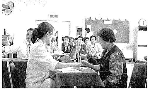
▲ 대구지부는 노인복지시설, 중앙초등학교 외 5개교 등의 원생 및 중식지원학생, 일반주민 650여명에게 무료건강검진을 실시했다.