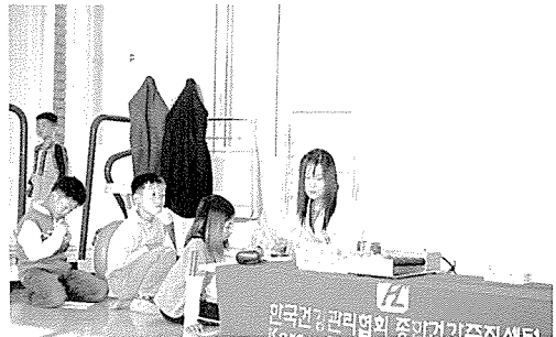
▲ 강원지부는 아동복지시설인 명동보육원 등의 원생 및 일반주민 190여명에게 무료건강검진을 실시했다.