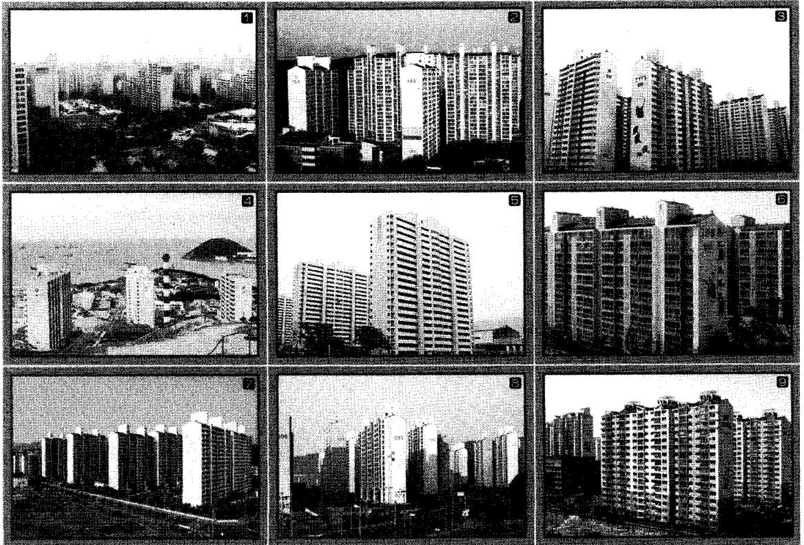
① 86아시아 선수촌 아파트 ② 수원 조원 주공아파트 ③ 수원 영통 주공아파트 ④ 부산 동삼주공아파트 ⑤ 산본주공아파트 ⑥ 안산 주공아파트 ⑦ 대구 칠곡 아파트 ⑧ 대구 달성 명곡 주공아파트 ⑨ 부천 상동 주공 아파트

의미로, 개발 원년때부터 고객의 사랑을 받아 아파트 브랜드화에 대 성공을 거뒀다는 평가를 받고 있다.