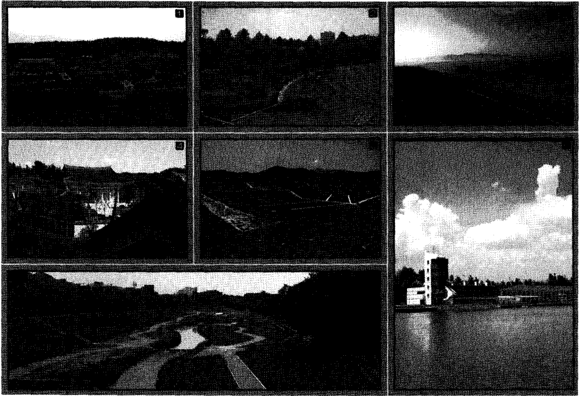
① 영락공원 ② 올림픽 주경기장 주변조경 ③ 보령 쓰레기매립장 ④ 사육신묘지 공원 ⑤ 제주 쓰레기매립장 ⑥ 미사리 조정경기장 ⑦ 양재천 조경