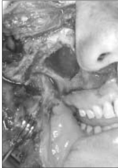
Fig. 5. Weber-Ferguson incision/c subcilicry extension