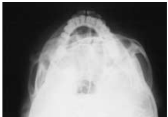
Fig. 8. After 5 months, Follow-up X-ray