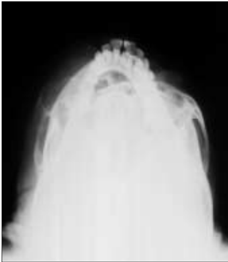
Fig. 1. Preoperative X-ray