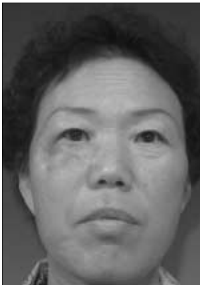
Fig. 7. After 5 months, Follow-up