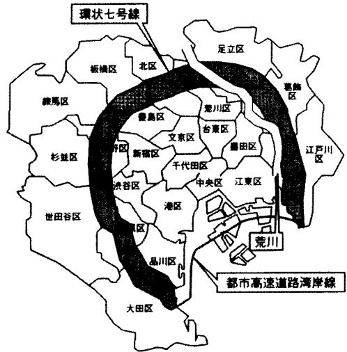
그림 1. 동경도 구부

※ 千代田區(치오다구), 中央區(쥬오우구), 港區(미나토구), 新宿區(신쥬꾸구), 文京區(분쿄우구), 台東區(타이토우구), 墨田區(스미다구), 江東區(코우토우구), 品川區(시나가와구), 目黒區(메구로구), 大田區(오오타구), 世田谷區(세타가야구), 澁谷區(시부야구), 中野區(나카노구), 杉並區(스기나미구), 豊島區(토시마구), 北區(키타구), 荒川區(아라카와구), 板橋區(이테바시구), 練馬區(네리마구), 足立區(다쓰시구), 葛飾區(카사이구), 江戶川區(에도가와구)