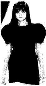
〈그림34〉 Marc Jacobs 03/04 F/W The Gist 100 Theme