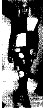
〈그림21〉 Pierrot, 03/04 F/W Gap Collections