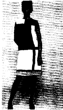
〈그림6〉 몬드리안 드레스, Yves Saint Laurent, 1965 A History of Costume in the West, p.429