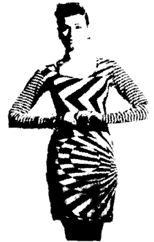
〈그림7〉 옴 아트 패턴의 원피스 패션과 의생활, p.119

이것은 60년대 패션에도 큰 영향을 미쳤는데, 기하학적 패턴(스트라이프, 체크, 물방울, 물결, 방사 무늬 등)이 서로 결합된 옴 패턴(Op pattern)을 의상 프린트에 사용함으로써 인체의 움직임에 직물의 운동감을 더한 새로운 조형적 감각을 창조하였다<그림 7, 그림 8, 그림 9>.