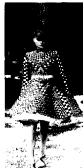
〈그림26〉 A. McQueen 03/04 F/W Gap Collections