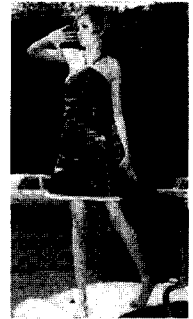
<그림1> 트위기의 미니스타일, 1966 A History of Fashion, p.57

1965년 영국의 디자이너 메리 퀴트(Mary Quant)에 의해 시도되어 32-22-32 인치 5) 라는 가장 '미니멀'한 마른 몸매를 가진 모델 트위기(Twiggy) <그림 1>에 의해 성공적으로 창조된 미니 스타일은 60년대의 순수한 기능성과 실용성을 추구하는 동시에, 청년문화, 성의 해방, 남녀평등 등 젊음과 자유를 향한 시대적 열망을 나타내는 새로운 개념의 혁신적인 패션미학이었다<그림2, 그림3>.