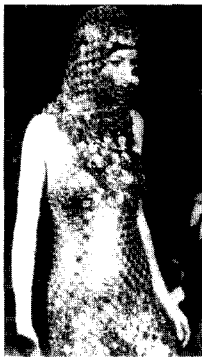
<그림12> 스페이스 룩 Paco Rabanne, 60년대 세계패션사 2, p.245

누구나 선망하는 '베이비 돌'(baby-doll) 이미지를 창출하였다<그림13>. 이러한 60년대 baby-doll 이미지는 어린아이같은 마른 몸매에 비달 사순(Vidal Sasson) 헤어커트로 유명한 짧은 머리, 아기 얼굴같은 진하고 큰 눈화장 등으로 표현되었다.