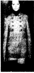
〈그림32〉 Jill Stuart 03/04 F/W The Gist 100 Theme

현대여성패션의 성인외복에서 유아적 이미지의 도입은 어린시절을 그리며 자유로움을 추구하는 현대인의 정신적 해방욕구에 기인하는 것으로서 환상적인 우화적 표현의 결과로 이해할 수 있다. 21)