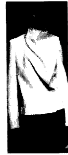
<그림19> Max Mara, 03/04 F/W Gap Collections