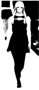
<그림29> Marc Jacobs 03/04 F/W Gap Collections