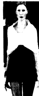
<그림18> Pringle, 03/04 F/W Gap Collections