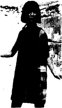
〈그림5〉 기하학적 패턴과 강렬한 색상, Pierre Cardin, 1965 Icons of Fashion, p.82

이러한 팝 아트의 영향으로 1960년대 패션은 재미있는 만화적 프린트, 추상적이고 대담한 무늬, 경쾌하고 강렬한 색상, 유희적인 기하학적 무늬, 대중성을 표현한 순수예술작품의 모티브 등 팝 아트적 개념과 요소를 적극적으로 도입하였다<그림 4, 그림 5, 그림 6>.