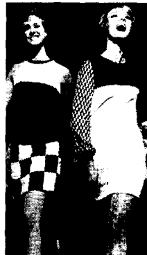
〈그림8〉 메리 퀸트의 미니드레스 Fashion, The Twentieth Century, p.209