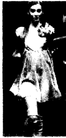
〈그림33〉 Blugirl 03/04 F/W The Gist 100 Theme