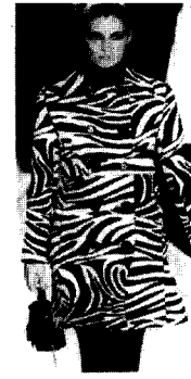
〈그림25〉 Celine 03/04 F/W Gap Collections