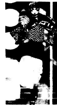
〈그림27〉 Dior 03/04 F/W Gap Collections