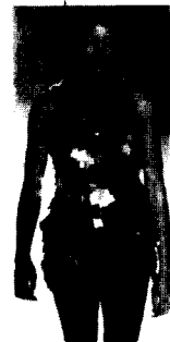
<그림31> Lopez 03/04 F/W Gap Collections