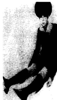
<그림15> 루디 건릭의 school-boy 스타일 현대복식미학, p.385