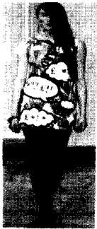
〈그림22〉 Tatty Devine, 03/04 F/W Fem Collections