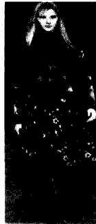
〈그림23〉 Cacharel, 03/04 F/W Gap Collections

티셔츠나 의복무늬 등에 상징기호나 문자, 숫자, 만화, 낙서같은 팝 아트적 요소를 패션 모티브로서 도입하거나, '몬드리안 룩' (Mondrian Look)과 같은 강렬한 색상 배합이나 추상적인 면 분할을 통해 선명한 시각적 효과를 나타내는 등 60년대 팝 아트 패션을 복고하는 경향을 쉽게 찾아볼 수 있다<그림20, 그림21, 그림22, 그림23>.