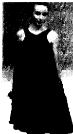
〈그림35〉 House of Jazz 03/04 F/W Fem Collections