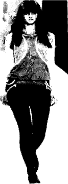
〈그림20〉 Marc Jacobs 03/04 F/W Gap Collections