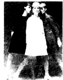
<그림3> 60년대의 미니멀 룩 패션디자인실무, p.79