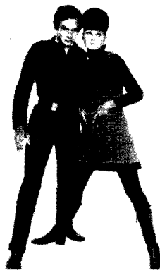
<그림11> 스페이스 룩 Pierre Cardin, 1967 A History of Costume in the West, p.435