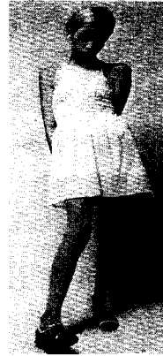
<그림13> 트위기의 baby-doll 룩 <그림14> 팜므 앙팡 스타일 20세기 패션, p.211 20세기 패션, p.208

이것은 젊음과 아이같은 순진무구함을 외형적으로 보여주는 '팜므 앙팡' (Femme-Enfant), 즉 '아이같은 여성' 11) 스타일을 창조하였다<그림14>. 60년대에 팜므 앙팡 스타일은 어린아이와 성인 여성의 중간에 존재하는 성의 애매함을 드러내면서 앤드로지너스(Androgynous)적인 여성미를 강화시켰다<그림15>.