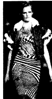
〈그림24〉 Dolce & Gabbana 03/04 F/W Gap Collections

옴 아트는 강렬한 시각에 직접 호소함으로써 대중의 시선을 끄는 데 그 어느 것보다도 적극적이며, 사회성이 강한 예술적 표현수단이 된다. 패션에서도 또한 다양화와 개성화를 추구하는 끊임없는 변화의 욕구를 충족시킬 수 있기 때문에 오늘날에도 크게 영향을 미치고 있다. 17) 03/04 F/W 컬렉션에 나타난 옴 아트 패션경향은 1960년대와 마찬가지로 강렬한 패턴과 뚜렷한 색상대비로 시각적 효과를 부각시키는 역동적인 조형성을 성취하고 있다. 비교적 간결한 형태의 A-라인, 바디 피트(body-fit)라인 등의 한정적 복종에 사용되었던 60년대와는 달리 03/04 F/W 시즌의 옴 아트 패션은