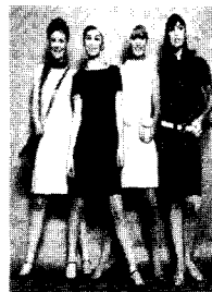
<그림2> 60년대의 미니멀 룩 A History of Fashion, p.64