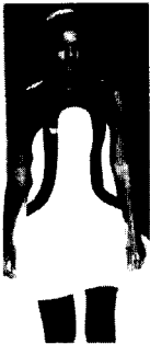
<그림28> Celine 03/04 F/W Gap Collections

03/04 F/W 컬렉션에 나타난 팜므 앙팡 스타일 경향은 유아적인 천진무구성을 추구하는 면에서는 60년대 '베이비 룩'(baby-look)과 다름이 없으나, 좀 더 소녀적 로맨티시즘(girlish romanticism)을 강화시킨 점에서 '가르손느' 스타일 개념의 60년대 패션과 차이가 있다<그림32, 그림33, 그림34, 그림 35>.