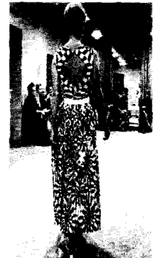
〈그림9〉 옴 아트 프린트 의상 Survey of Historic Costume, p.446