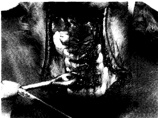
Fig 3. A buccal mucosal flap is sutured into the defect left after undermining and moving the hard palate mucoperiosteal flap.

구개열을 정복하였다. 7일 후 봉합사와 피딩튜브를 제거한 후, 유동식을 자유섭식하게 하면서 점차 건사료와 물로 전환하였으며, 재채기, 기침과 같은 수술 전 증상은 나타나지 않았다.