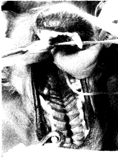
Fig 1. A 7-month-old dog with cleft hard palate. The dog is positioned in dorsal recumbency with an endotracheal tube in place and the tongue secured around the tube and the mandible.