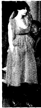
〈그림15〉 Toga 2004 F/W Toko collection