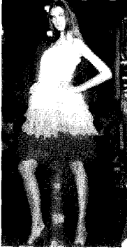
<그림20> Jill Stuart 2004 S/S New York collection