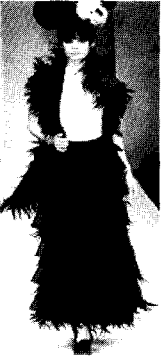
<그림19> Junko Koshino 2002 F/W Toko collection

크라인과 소매부분을 장식했는데 우아하면서 풍성한 느낌을 효과적으로 연출하였다<그림21>.