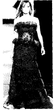
<그림9> Valentino 2002 S/S Paris Haute Couture Collection