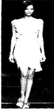
〈그림11〉 Alberta Ferretti 2004 S/S Milan collection