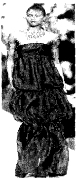
<그림4> Yves Saint Laurent 2001 S/S Paris Haute Couture Collection