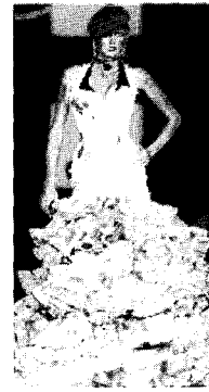
〈그림17〉 Cristian Dior 2004 F/W Paris Haute Couture Collection