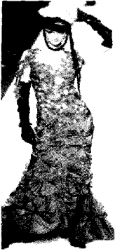
〈그림10〉 Jeal Paul Gaultier 2003 F/W Paris Haute Couture Collection