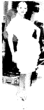
<그림7> Hanae Mori 2001 S/S Paris Haute Couture Collection

2001년 S/S 파리 컬렉션에서 Hanae Mori는 화이트 톨소재의 원피스의 옆 허리선에서 시작하여 원형으로 여러줄의 개더를 잡아 가슴선과 햄라인에서 풍성한 느낌이 나도록 디자인하였다<그림7>. 또한, <그림8>과 같이 시폰 드레스의 앞 배부분에 여러줄의 개더를 잡아 평행의 미와 함께 작은 지역에 걸쳐 복잡한 울동을 나타내었다. 2002년 S/S 파리 컬렉션에서 Valentino는 시폰소재의 드레스에 자수와 함께 가슴부터 햄라인까지 여러줄의 개더를 잡아 여성스러우면서도 귀여운 디자인을 선보였다<그림9>.