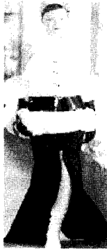
<그림21> Chanel 2004 F/W Paris Haute Couture Collection