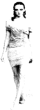
<그림6> Sopha Kokosalaki 2004 S/S Paris collection