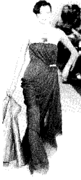
<그림2> Hanae Mori 2002 S/S Paris Haute Couture Collection