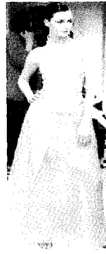
<그림8> Hanae Mori 2001 S/S Paris Haute Couture Collection