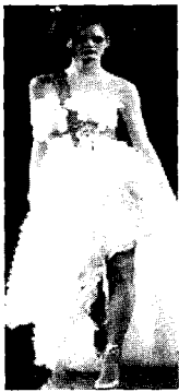
〈그림13〉 Cristian Lacroix 2001 S/S Paris Haute Couture Collection

2001년 S/S 파리 컬렉션에서 Cristian Lacroix는 비대칭 헴라인의 화이트 드레스에 사선방향으로 촘촘히 프릴을 달아 반복에 의한 생동감을 연출하였다<그림13>. 2002년 S/S 런던 컬렉션에서 Blaak은 실크, 면, 툴과 같은 서로다른 소재를 매치시켜 위에서 아래로 내려올수록 프릴의 크기를 변화시켜 활동적인 느낌을 주었다<그림14>. 2004년 F/W 도쿄 컬렉션에서 Toga는 레드 드레스의 웨이스트 라인에 프릴을 여러 겹 달아 시선을 집중시키며 귀여운 이미지를 주었다<그림15>.