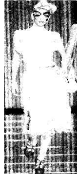
〈그림12〉 John Galiano 2004 F/W Paris collection