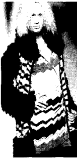
〈그림18〉 Missoni 04/05 F/W, Collezioni Trends No.64