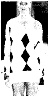
〈그림9〉 Pringle 03/04 F/W, Fashion News Vol.86, p.129