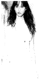
〈그림6〉 John Rocha 04 S/S, Collezioni Trends No.66, p.116

에는 유년시절의 향수가 있다고 생각된다. 이 새로운 유행은 디자이너들에게 까지 전파되어 수많은 크로세 아이템이 유명 컬렉션에서 선보이게 되었다. 국내에서도 예술적인 크로세 니트웨어가 임희희, 루비나, 송자인 등의 유명 디자이너들에 의해 컬렉션에 등장하고 있다.