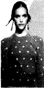
〈그림7〉 Clements Ribeiro, 01 A/W, 「Knitwear in Fashion」, p.18