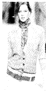
<그림13> Louis Vuitton 04 S/S, Collezioni Trends No.66, p.120