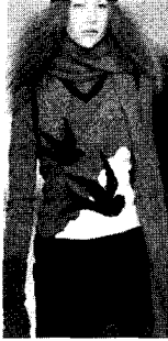
〈그림17〉 Sportmax 05/06 A/W, Collezioni Trends No.68, p.128