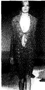
〈그림5〉 Joaquim Verdu 03/04 A/W, Collezioni Trends No.64