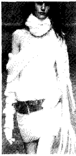
〈그림4〉 Laura Biagiotti 03/04 A/W, Collezioni Trends No.64