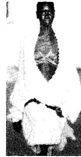
<그림1> Catherine Malandrino 04/05 W, Collezioni Trends No.68, p.107

<그림5>은 코바늘뜨기로 만든 니트 원피스와 코트로, 여성스러운 분위기를 낸다. <그림6>은 John Rocha의 2004년 S/S 컬렉션 작품으로, 프릴모양의 디테일로 코바늘뜨기에 의해 입체감을 주었다. 최근들어 멋쟁이 뉴요커들과 파리지엔드들 사이에서 코바늘 뜨개질이 유행이라고 하는데, 25) 그 배경