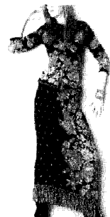
<그림16> Apriocot 03 S/S, Maglieria Italiana N.134, p.14