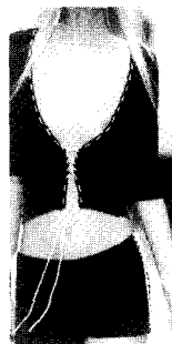
<그림14> Tomaso Stefanelli 03 A/W, Maglieria Italiana. N.134, p.110