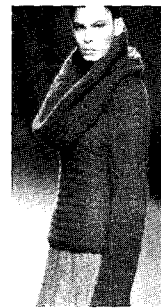
<그림2> Jesus Del Pozo 04/05 W, Collezioni Trends No.68, p.108