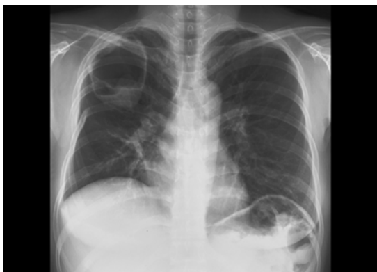
Fig. 2. Chest X-ray, on admission, shows a well demarcated huge lesion in the right upper lung field, suggestive of an air-crescent.

림 2)에서는 경계가 분명한 종괴양 병변이 관찰되었다. 3개월전 기침을 주소로 타원 방문하여 촬영한 흉부 CT(그림 3A)상 우상엽에 4cm 크기의 공동으로 보이는 병변이 관찰되었으며 그 후 항결핵 약물치료를 하며 지내던중 기침 호전되지 않아 본