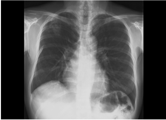
Fig. 4. The cavitary lesion was markedly decreased after 3 months of treatment with prednisone and itraconazole.

아토피를 지닌 사람에서는 기관지 천식에서부터 면역억제제 등에서는 전신적 침습성 아스페르길루스증에 이르기까지 여러 가지 질병과 관계되는 진균이다 1 . 폐국균증은 Hinson의 분류에 따라 크게 allergic aspergillosis, 국균증(colonizing aspergillosis), 침습성 국균증의 3가지로 분류하며, allergic aspergillosis에는 ABPA, 그리고 allergic aspergillus sinusitis(AAS)가 있다 1-3 .