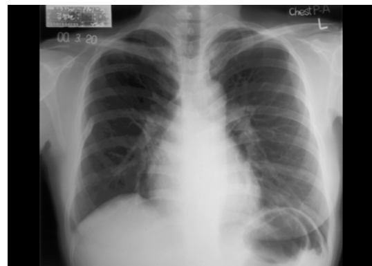
Fig. 1. Chest X-ray, 3 years before admission, shows normal finding after anti-tuberculous chemotherapy.

방사선소견 : 내원 3년전 항결핵 약물치료 완료 후 촬영한 단순 흉부촬영(그림 1)상 특이소견 보이지 않으나, 본원 내원 당시 촬영한 단순 흉부촬영(그