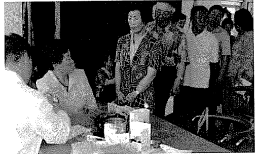
▲ 강원지부는 노인복지시설인 춘천사랑의 집 등의 원생 160여 명에게 무료건강검진을 실시하였다.