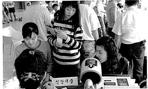
▲ 광주·전남지부는 아동복지시설 등의 원생 및 일반주민 3,250여 명에게 무료건강검진을 실시하였다.