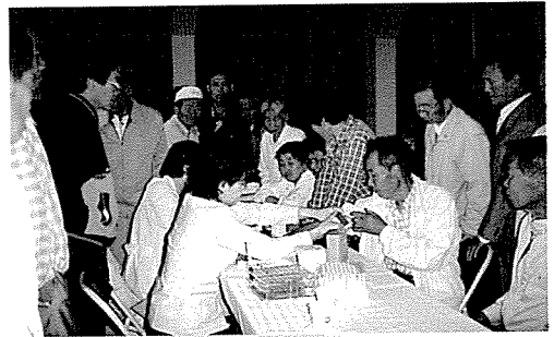
▲ 전북지부는 노인복지시설인 전주요양원, 군산남고등학교 외 18개교 등의 원생 및 중식지원학생, 일반주민, 기초생활보장수급권자 890여 명에게 무료건강검진을 실시했다.