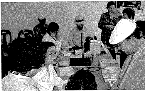
▲ 광주·전남지부는 경신여자고등학교 등의 중식지원학생 및 일반주민 1,150여 명에게 무료건강검진을 실시했다.