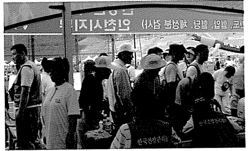
▲ 인천지부는 아동복지시설인 시운육아원, 노인복지시설인 성안나의 집, 간석초등학교 외 36개교 등의 원생 및 중식지원학생 400여 명에게 무료건강검진을 실시했다.