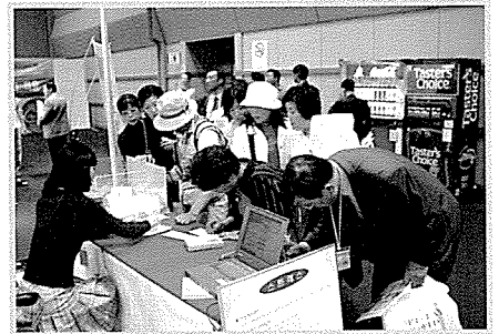
▲ 관람객의 종합검진권 응모