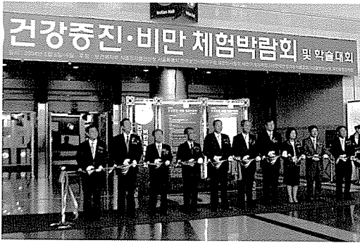
▲ 개막식 행사