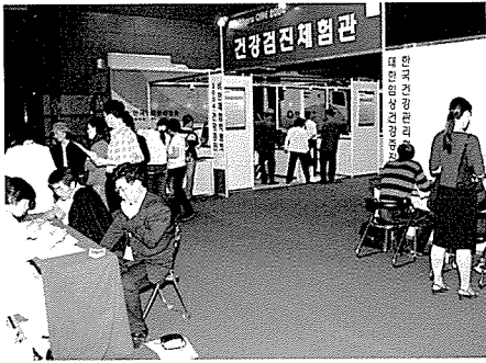
▲ 한국건강관리협회가 운영한 건강검진체험관의 무료건강검진