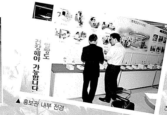
▲ 홍보관 내부 전경