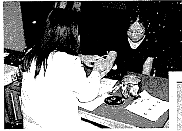
◀ 건강검진체험관에서의 채혈 장면