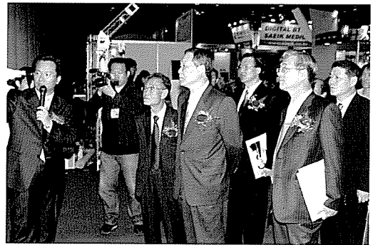
▲ 박람회 행사장을 둘러보는 참석 인사