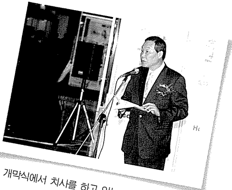
▲ 개막식에서 축사를 하고 있는 보건복지부 강윤구 차관