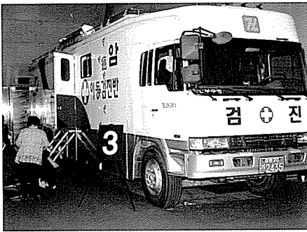
▲ 한국건강관리협회 종합검진차량을 이용한 암검진