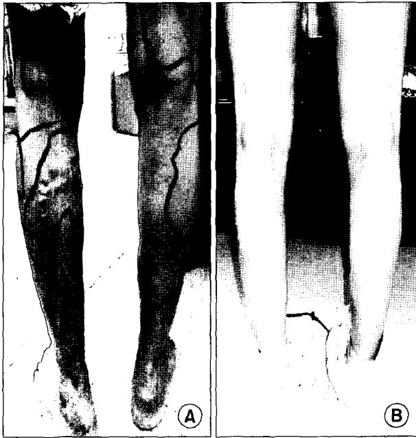
Fig. 2. Picture of pre-operative state (A) and post-operative 4 week state (B).

4예(4.8%)였으며 레이저로 분명히 정맥류를 치료하였음에도 불구하고 일부 정맥류가 남아있던 경우가 15예(17.8%)였다. 그 외 정맥류를 발견하지 못하여 치료하지 않은 경우와 레이저 치료 후에도 정맥류가 완전히 치료되지 않아서 일부 남아 있는 경우가 같이 공존하였던 경우가 9예(9.5%)였다. 이를 다시 대복재정맥이나 소복재정맥에서 혈류의 역류유무가 술 전에 관찰되었던 경우로 세분하여 보았으나 특별한 관련성은 없었다(Table 4). 레이저 치료시 정맥류를 발견치 못한 경우와 레이저 치료 후에도 정맥류가 남아 있던 경우는 모두 중심정맥(traucaul vein)이 아니라 가지 혈관 일부에서 관찰된 경우였다. 이러한 정맥류들은 수술 후 외래 추적 1개월 후에 경화요법으로 치료하였다. 경화주사제로는 thromboject 1%를 사용하였으며 편측하지당 평균 1.7개(범위 1~3개)를 사용하였다. 경화치료 후에는 약 2주간 추가로 압박스타킹을 착용시켰다.