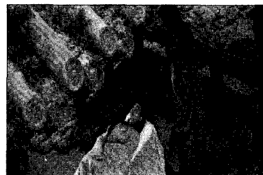
<그림 12> 파검과 비설의 슬픔