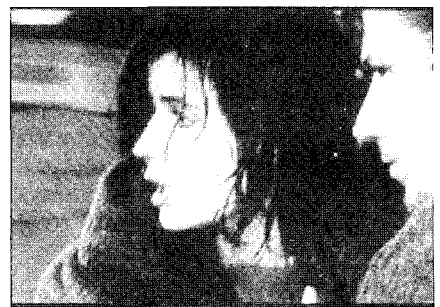
<그림 8> 배가 구조되었을 때