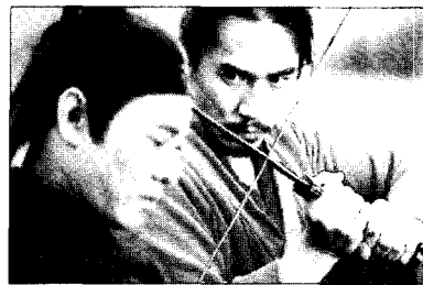
<그림 11> 무명과 대결하는 파검