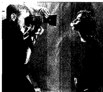
<그림 7> 모델 촬영