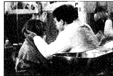
<그림 5> 카롤의 하양색의 남루한 의상

미지를 그려내고 있다. 한편 카롤의 하양색의 남루한 옷차림은<그림 5> 하양색의 부정적 성향인 공허와 빈곤의 초라함을 보여주고 있다.