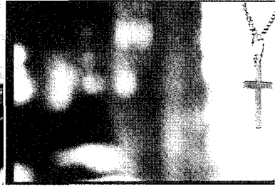
<그림 3> 십자가 목걸이

영화 <제2편-화이트>에서 나타난 하양색의 상징은 평등을 의미한다. 하양색은 순결의 의미와 더불어 성격의 부재로 무의미와 무한대의 인상을 창출한다 9) . 하양색에 대한 느낌은 민족에 관계없이 순결, 순수함으로 나타난다. 서양에서도 하양색은 하얀 비둘기나 종교적인 복장, 천사, 신부의 웨딩드레스 등과 같이 순결한 이미지를 대표하고 있다 10) . 영화 전반에 보이는 하양색 건물, 하양색 웨딩드레스<그림 4>, 하양색 비둘기, 카롤의 하양색의 남루한 의상<그림 5> 등이 하양색의 이미지로 나타난다. 자본주의적 가치관이 잘 나타나 있는 <제 2편-화이트>는 <제1편-블루>처럼 온통 흰빛으로 꾸며져 있지는 않지만 ‘평등’의 색으로서의 흰색을 적절히 사용하고 있다 11) .