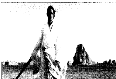
<그림 13> 마지막 비설과 대결하는 파검