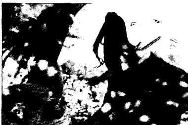
<그림 9> 비설과 여월의 검투 장면