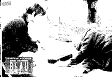
<그림 2> 걸인과의 대화