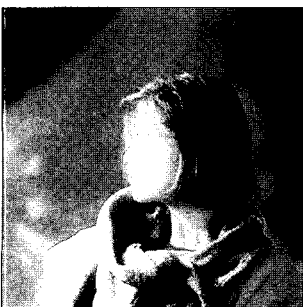
<그림 6> 포스터