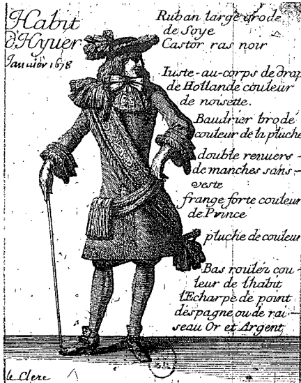
〈그림5〉 Mercure galant , S. Leclerc, 프랑스 국립도서관, 1678