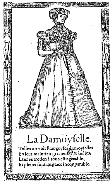
〈그림2〉 Diversité des Habits, François Desprez, 프랑스 국립도서관, 1562

심”에 부흥하기 위한 주제를 주로 담고 있는 흐름 속에서 1562년 François Desprez는 “유럽, 아시아, 아프리카에서 사용된 다양한 복식 전집 (Recueil diversité des habits)”이란 제목의 민속 이미지 모음을 발간하였다. 그중 각 유럽지역의 특징을 담은 복식들을 발견 할 수 있는데, 스위스여인, 독일인, 헝가리여인, 파리의 부르주아적 여인 등이다. 소개된 인물의 계층과 직업 등에 대한 글을 함께 신고 있다. 패션을 주제로 한 것은 아니지만 처음으로 외양에 대한 관심을 묘사한 목판화이다.