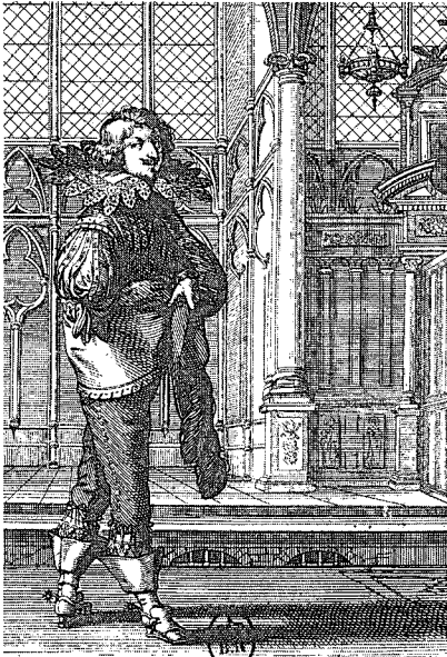
〈그림3〉 La Noblesse française à l'église, A. Bosse, 프랑스 국립도서관, 1630