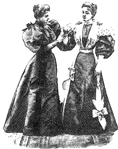
MODE de la rue de la Harpe, N° 10. Rue de la Harpe, N° 10. Rue de la Harpe, N° 10.

18세기말부터 시작하여 19세기에 패션잡지 생산의 증가는 이미 선형적으로도 폭발적인 대중의 수요와 매체로써의 그 역할을 알게 한다. 그러므로 패션잡지 형성시기 전후인 17세기의 상업적 환경을 단층 적으로 조사하여 그 역할을 확정지을 수