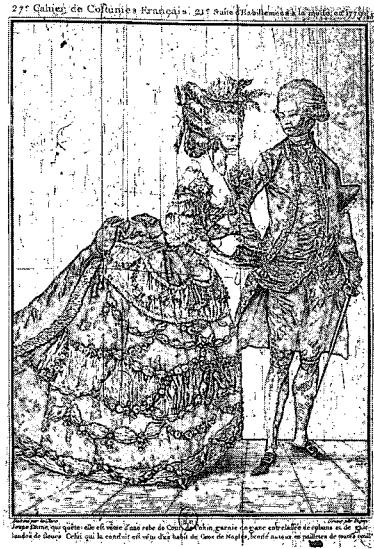
〈그림6〉 La Galerie des modes et costumes françaises , Esnault & Rapilly, 프랑스 국립도서관, 1779

Nouvelleistes) 이 월간으로, 1758년에 '새로움의 잡지 ( Le Courrier de la Nouveauté )'가 주간으로, 1768년부터 1770년까지는 '패션과 취향의 저널 ( Journal du Goût ou le Courrier de la Mode )' 이 월간으로 각각 출간되는 등, 복식 뿐 아니라 새로운 세계에 대한 호기심을 모아 작은 크기의 판화에 내용 묘사를 손으로 써서 소개하여 패션잡지의 면모를 갖추어 갔다. 이때부터 패션판화는 잡지로서 본격적인 모양새를 드러내게 된다.