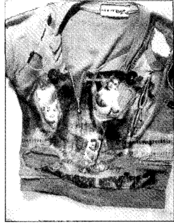
〈그림3〉 지퍼달린 티셔츠 Clair Wilcox, Vivienne Westwood, V&A Publications, 2004, p.39

핑크라는 말이 '아무짝에도 쓸모없는'이란 의미를 담고 있듯이 디스트로이 등의 핑크 록 티셔츠는 어떤 대안적인 것을 지향하는 것이 아니라 당시 웨스트우드와 맥라렌의 모든 것을 부정하는 반역적이고 무정부주의적인 성향을 고스란히 드러내고 있다. 닭 뼈로 sex나 rock이라는 글자를 조합해낸 티셔츠, 지퍼로 젖꼭지를 드러낼 수 있게 만든 티셔츠<그림3>도 마찬가지로 반역적인 것이었다. 섹스는 웨스트우드와 맥라렌이 가장 즐겨 사용하던 기성권위에 대한 대항 무기였다. 1970년대 초의 당시에도 섹스를 공개적으로 이야기하는 것은 터부로 여겨져 있었다. 그러나 이미 풍요와 자유가 극에 달했던 당시 사회에서 성해방은 거의 이루어진 상태였다. 다만 이에 대해서 공개적으로 드러내어 말하는 것은 터부시되었던 것이다. 맥라렌과 웨스트우드는 이러한 위선적인 사회 분위기에 반역하는 무기로 공개적인 섹스 이야기를 사용한 것이다. 그들은 상점 이름도 Sex라고 붙이고, 맥라렌의 밴드 이름을 Sex Pistols라고 이름붙이는 등 섹스를 공개적으로 상표로서 내놓았던 것이다. 그들은 티셔츠에 훨씬 자극적인 '케임브리지 강