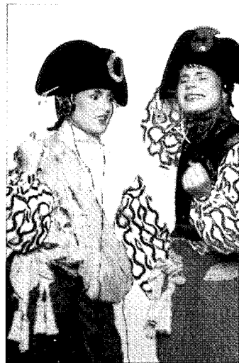
〈그림5〉 해적 컬렉션 www.viviennewestwood.com

웨스트우드의 해적 컬렉션은 그녀의 완전한 변신을 보여주었다. 검은색의 모노톤으로부터 화려