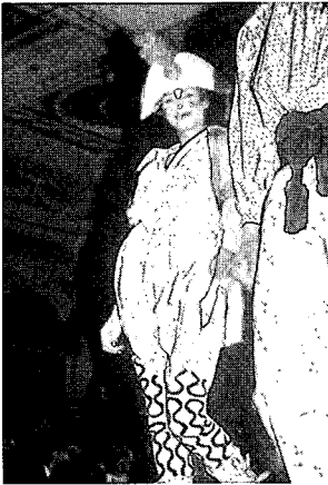
〈그림6〉 해적컬렉션 www.viviennewestwood.com

해적 컬렉션은 즉각 주류 패션계의 관심을 끌었고, 웨스트우드도 주류 패션계에서 패션 디자이너로서 인정을 받기 시작했다. 그 전에 그녀는 유별난 반항적인 부티크 주인 정도로 인식되어 있었다 14) . 1980년대, 40대에 접어든 웨스트우드는 이제부터 주류 패션계 안에서 정치성이 강한 참신한 패션으로 독보적인 위치에 도달하는 여정에 들어간 것이다.