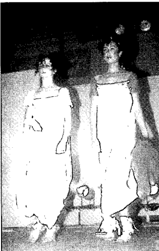
〈그림7〉 해적컬렉션 www.viviennewestwood.com