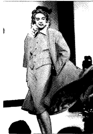
〈그림9〉 전통적 여성성을 부각시킨 패션 www.viviennewestwood.com

페미니스트 들이 여성의 신체를 가능한 한 감추고 남성과 동등한 모습을 보여주는 의상을 선호한 반면 웨스트우드는 이러한 시도를 대단히 어리석은 것으로 생각했다. 그녀는 “나는 이등 남성 같이 되는 것이 힘이 있는 것이라고 결코 생각한 적이 없다. 여성성은 강한 것인데<그림9>, 사람들이 이 재미없는 무성(無性)의 신체를 왜 그렇게 집요하게 이야기하는지 이해할 수 없다 19) ”고 말할 정도로 무성의 강조에 대해서 냉소적이었다. 그녀는 여성의 신체를 강조하는 것이 오히려 남성과 동등해지는 것일 뿐 아니라, 여성이 더 특별하다는 것을 보여준다고 생각했다. 페미니스트 들은 이러한 그녀의 태도에 대해서 비판했다. 매우 전투적이고 정치성이 뛰어난 웨스트우드가 여성의 신체를 강조하는