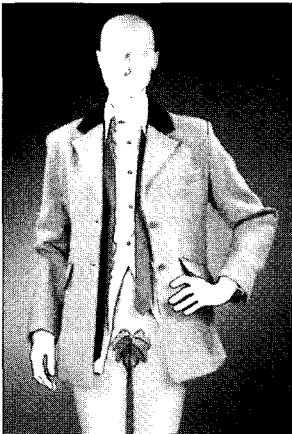
〈그림8〉 여성성의 강조 www.viviennewestwood.com

계, 소비사회에 대한 그녀의 비판 등이 패션에서도 나타났다. 그녀 자신도 정치성이 매우 강했지만, 그녀는 1960년대와 70년대의 정치성이 강한 페미니스트 들 의 성 과 의상에 대한 생각과는 전혀 다른 시각을 가지고 작업을 했다. 1960년대와 70년대의 페미니스트 들은 유행 의상에 단호하게 반대했다. 이들은 여성의 성을 드러내는 의상에 대해 거부감을 가지고 있었고<그림8>, 가능한 한 이러한 신체과시를 억제하는 의상을 선호하고 퍼뜨리려 했다. 예를 들어 그들은 여성 의상의 남성화를 통해 의상에서도 남녀의 동등함을 추구하려 했던 것이다 16)17)18) .