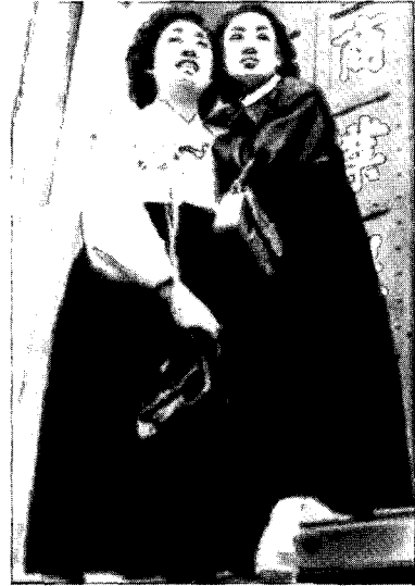
〈그림18〉 1950,60년대의 한복

이러한 한복개량에 대한 비판은 20세기 초반부터 계속되어왔는데, 그 이유는 위에서 제시한 것과 같이 우리 전통적인 고유의 미를 상실하고 서양복의 구성을 한복에 적용하여 그 옷을 입었을 때, 양