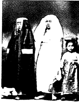
〈그림10〉 장옷차림의 개혁기 여인, 사진으로 보는 조선 백년, 동아일보사, p.744.

여학교에서의 쓰개치마 금지는 1908년 貞信학교와 한성여학교에서 시작하여 1911년 梨花學堂, 培花학교, 17) 崇義 여학교가 금지하였고 1900