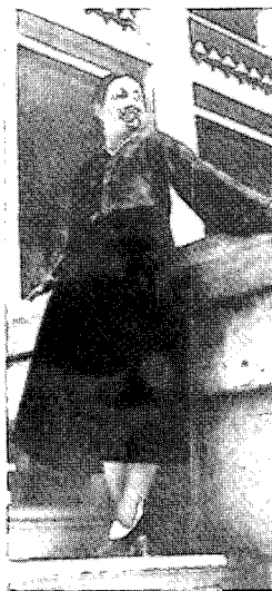
〈그림16〉 1940년대 여성복식

1949년, 서울시에서 신생활 운동을 전개하여 의식주를 비롯한 예의 등 5개 분과 위원회를 두었는데 이를 신생활장려 추진위원회라 하였다. 이 신생활장려추진위원회는 여러 방면으로 토의를 거듭하고 의류분과 위원회를 개최하여 간단하고도 염가인 여름 남녀 의복을 결정하였는데 개량 한복 모양의 간이복이었다. 일반 가정부