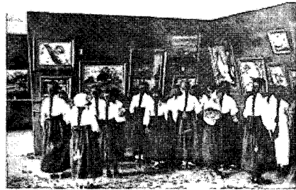
〈그림14〉 미술전람회를 구경하는 여학생들, 1915년경, 사진으로 본 조선시대 민족의 사진첩1, p.142

1930년대에 이르러서는 染色衣宣傳歌를 제정, 부르게 하고 染色衣宣傳標語의 모집과 함께 배리를 뿌리기도 하였다. 또한 백의 착용자는 버스의 착용을 금지시키거나 관공서 출입을 제한하고 물총에 검은 물감을 넣어 쏘기도 하여 강제성을 띠고 있었다. 29)