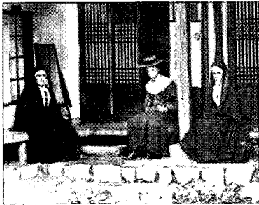
〈그림6〉 1905년의 여선교사와 수녀, 사진으로 본 조선시대 민족의 사진첩1, p.181

하고 실용적인 학문에 관심을 갖기 시작하였다. 또한 서구 열강들이 영토확장과 경제적인 이득의 목적으로 무력을 앞세우고 식민지 개척에 나서기 시작하면서 동양의 많은 나라들이 이들에게 개항하였으며 조선은 1876년 미국과 丙子修護條約을 맺으면서 서구문명과 직접, 간접적으로 접촉하기 시작하였다. 6) 내부적으로는 동학사상의 영향으로 시민들의 개화의식을 맹아 시켰는데, 이 사상은 남녀평등과 여성존중을 강조했다. 1883년 친미사절단이 미국, 구라파를 돌아보고 올 때, 양복 한 벌씩을 사가지고 왔는데 이들은 황제에게 복제개혁을 건의했고 그 이듬해인 1884년에 甲申衣制改革이 단행되었다. 이 衣制改革은 수구파의 반대로 실행에 옮기지 못하고 있다가 개혁파와의 의견을 종합한 중용적인 성격을 가지고 있으며, 衣制의 간소화를 꾀하였다. 그러나 이 개혁에 대한 반대 상소가 끊이지 않아 잘 시행되지 않았다.