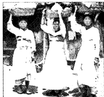
〈그림7〉 1900년대 짧은 저고리, 치마의 한복, 사진으로 본 조선시대 민족의 사진첩2, p.12

이듬해인 1895년에는 단발령이 내려졌는데 이때, 공식적으로 양복의 착용이 허용되고 군복이 양장화 되었다. 1899년에는 외교관의 복장을 양복화하였으며, 이듬해인 1900년 4월 17일에는 칙령 14