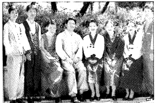
〈그림19〉 1997년 미란다 호텔 유니폼, 한복, 그여유와 생명력, p.11

정부는 1996년 12월 '한복 입는 날'을 제정, 1997년 공포하여 한복에 대한 관심이 더욱 높아지고 생활한복을 일상복으로 보급화하기 위해 힘을