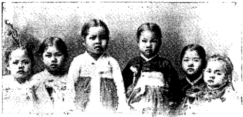
〈그림9〉 이화학당에 입학하는 여학생들, 1900년, 사진으로 본 조선시대 민족의 사진첩1, p.125

호로 문관복장 규칙을 정하고 제 15호로 문관대례 복제식을 정했으며 제 13호로 훈장규칙을 정하여 양복을 착용하도록 정하였다. 이것은 신라 28대 진덕 여왕 이래 조선 509년까지 착용해온 중국식 관복이 구미식 관복으로 변화된 획기적인 사건이며, 10) 관복의 양복화가 법으로 제정됨에 있어서 남성의 복식이 한복에서 양장으로의 변화가 그렇지 않았던 여성복의 변화보다 매우 빠르게 전환되었다. 1898년 찬양회에서 장옷폐지에 대한 상소를 정부에 제출했으나 여자 의복의 개량은 급선무가 아니라는 이유로 인허를 받지 못하였다. 11)