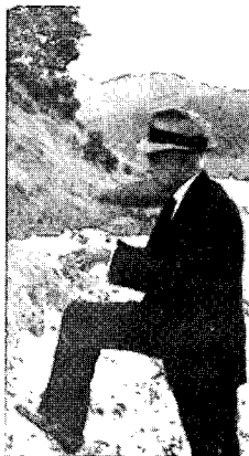
〈그림3〉 거리 선교하는 남자 선교사, 사진으로 본 조선시대 민족의 사진첩1, p.183