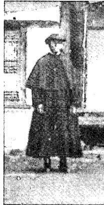
〈그림1〉 사진으로 본 조선시대 민족의 사진첩1, p.178

조선 후기 중국을 통한 천주교, 외국 서적, 문물의 유입, 선교사들의 직접적인 포교활동은 일부 계층이긴 하지만 조선 사람들에게 접해보지 못한 미지의 세계에 호기심을 유발하였으며 그들의 평등