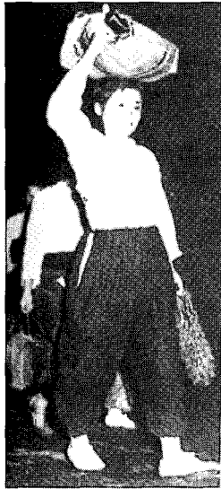
〈그림15〉 몸뻘을 착용한 여인, 사진으로 보는 조선 백년, 동아일보사, p.745

회를 후원했을 뿐 아니라 소학교 교과서에까지 색복 입을 것을 일대시정강목으로 강요하는 내용을 넣었다. 1940년에는 국민복을 제정하였고 1942년에는 여성용 표준복을 제정하였는데 甲型(양복형), 乙型(한, 화복형), 활동의(1호: 슬렉스, 2호: 몸뻘)가 있었다. 이 여성용 표준복은 후생성 산하의 부인 표준복 연구회에서 1년간의 연구를 거친 후 기능성을 강조한 한복의 모습과 비슷한 형으로 정하였다.