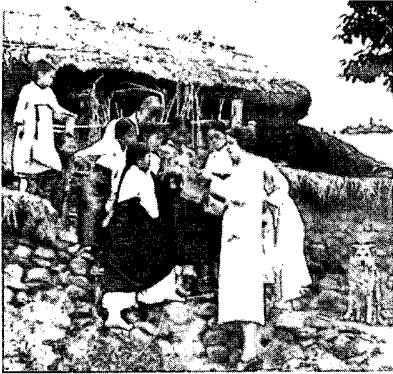
〈그림5〉 여선교사의 복장, 1900년, 사진으로 본 조선시대 민족의 사진첩1, p.170