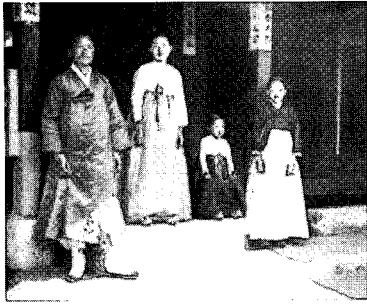
〈그림8〉 순색저고리, 치마의 한복, 1900년, 사진으로 본 조선시대 민족의 사진첩3, p.11

호로 문관복장 규칙을 정하고 제 15호로 문관대례 복제식을 정했으며 제 13호로 훈장규칙을 정하여 양복을 착용하도록 정하였다. 이것은 신라 28대 진덕 여왕 이래 조선 509년까지 착용해온 중국식 관복이 구미식 관복으로 변화된 획기적인 사건이며, 10) 관복의 양복화가 법으로 제정됨에 있어서 남성의 복식이 한복에서 양장으로의 변화가 그렇지 않았던 여성복의 변화보다 매우 빠르게 전환되었다. 1898년 찬양회에서 장옷폐지에 대한 상소를 정부에 제출했으나 여자 의복의 개량은 급선무가 아니라는 이유로 인허를 받지 못하였다. 11)