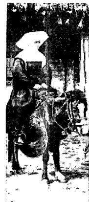
〈그림4〉 사진으로 본 조선시대 민족의 사진첩1, p.184