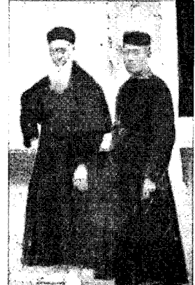
〈그림2〉 사진으로 본 조선시대 민족의 사진첩1, p.180