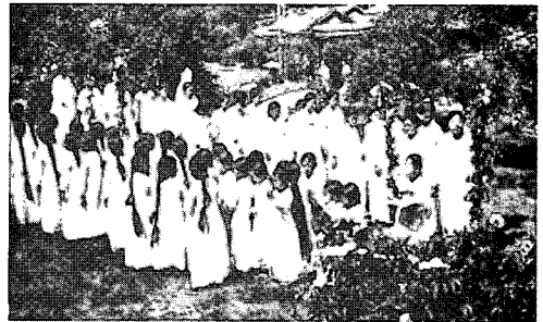
〈그림12〉 1915년 이화학당의 교복, 사진으로 본 조선시대 민족의 사진첩1, p.147