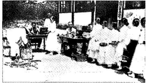
〈그림13〉 달걀배금을 받는 여인들, 1932년, 사진으로 보는 조선 백년, 동아일보사, p.575

발목을 노출시키던 것이 점점 짧아졌다. 반면 일반여성들은 짧은 저고리에 긴 치마인 전통형의 한복을 주로 입었으나, 긴 저고리를 착용하기도 하여 1920년대의 여성한복은 긴 저고리와 짧은 저고리, 긴치마와 짧은 치마의 이중구조를 보인다. 28)