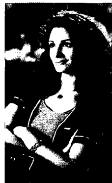
〈그림7〉 My Best Friend Wedding