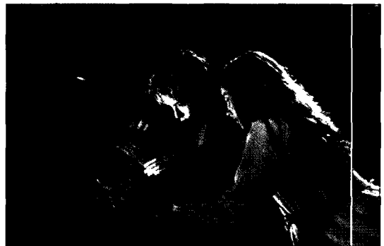
〈그림14〉 Peter Pan