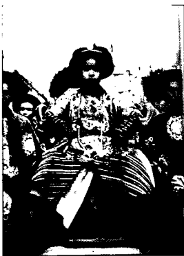
〈그림1〉 Last Emperor

그는 마지막 황제 (1987), 마지막 사랑 Sheltering Sky (1990), 리틀 부다 Little Buddha (1994)등 베르나르도 베르톨루치 (Bernardo Bertolucci 1940-, 이탈리아)의 멋진 영화들의 의상 작업을 하였다.