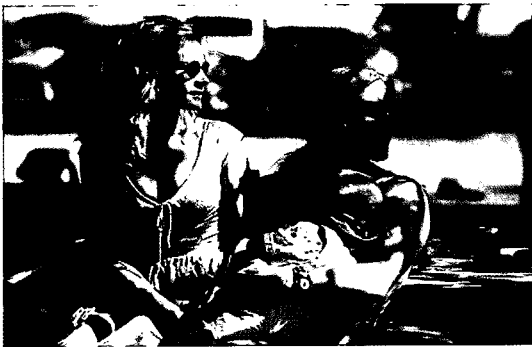
〈그림8〉 Erin Brockovich