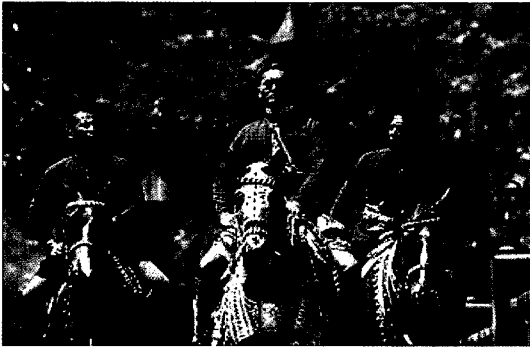
〈그림9〉 Anna and the King