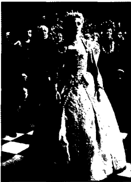
〈그림5〉 Shakespeare in Love 한 바 있는 디자이너이다.

Sandy Powell은 현대의상도 잘 만들어내는 디자이너지만 르네상스 시대부터 1800년대에 이르는 유럽 의상들의 프로필이나 가발 등에 주력해서 작업을 한다. Powell은 영국 아방가르드 계열의 감독 Derek Jarman(데릭 저먼 1942-94, 영국)의 Caravaggio (1986) The Last of England (1987), Sally Potter(샬리 포터)의 Orlando , Neil Jordan(닐 조던 1925- , 아일랜드)의 Crying Game (1992), Interview with the Vampire (1994) 등의 작품을 위해 우아한 의상들을 작업했다.