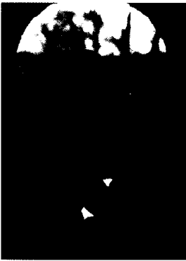
〈그림10〉 Ever After

이제 Beavan은 period cinema의 의상 제작에 있어 그야말로 시대를 초월한다. 지금까지 40여편이 넘는 영화, TV 등에서 의상을 제작하여 왔으며, 앞으로도 그녀는 시대를 재현하는 아름다운 의상을 통한 배우들의 이미지 창조를 계속 할 것이라고 기대된다.