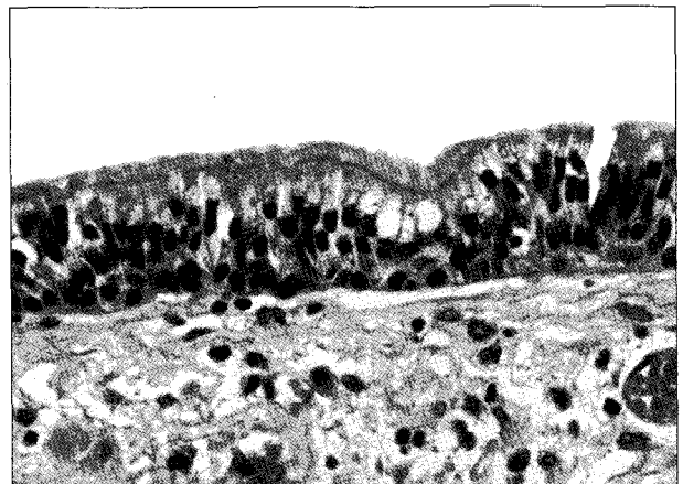
Fig. 3. Photomicrograph of the surgical specimen showing typical pseudostratified ciliated columnar epithelium, which suggests that it is a bronchogenic cyst (H&E, \times 400 ).

식도 조영술에서 종양은 관찰되지 않으며 제거 부위의 누출 등도 없었다. 수술 후 3개월이 지난 현재 연하곤란 및 속쓰림 등 증상의 재발 없이 외래 추적 관찰 중이다.