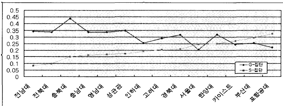
[그림 3] 대학별 G와 S집단의 비율

먼저 통계분석 결과를 토대로 각 대학의 S-집단(공돌이 집단)와 G-집단의 비율을 비교해 보았다. [그림 3]에서 보면 우측에 주로 위치한 일반적인 상위권 대학에서 P-score가 낮고 M-score가 높은 S-집단(공돌이)의 비중이 매우 크게 나타나는 것으로 조사되었다. 또한 S-집단(공돌이)와 대조되는 G-집단의 비율은 상대적으로 낮음을 알 수 있다. 이는 이공계 위기 분석과 교육 만족도의 적용이 단순히 기존 연구에서처럼 전국의 이공계 모든 대학에 천편일률적으로 적용되어서는 안 된다는 것을 나타낸다. 공학교육의 만족도 수준을 높이기 위해서 각 대학의 상황과 특색에 맞게 교육과정을 변화 적용시켜 나가야 할 것이다.