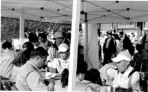
▲ 인천지부는 장애인시설 및 아동복지시설 생활자, 일반주민 등 600여 명에게 무료건강검진을 실시하였다.

한국건강관리협회는 봉사와 희생을 실천하고 있습니다. 지난 11월 한달 동안에도 19천 4백 5십여 명에게 무료건강검진과 건강상담을 실시하여 아름다운 만남을 실천하였습니다.