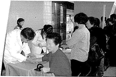
▲ 충북지부는 노인복지시설 생활자, 오·벽지주민 등 300여 명에게 무료건강검진을 실시하였다.