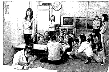
▲ 부산 무료검진 현장