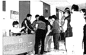
▲ 광주·전남 무료검진 현장