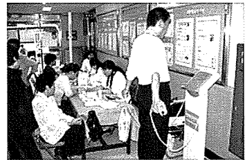
▲ 울산 무료검진 현장