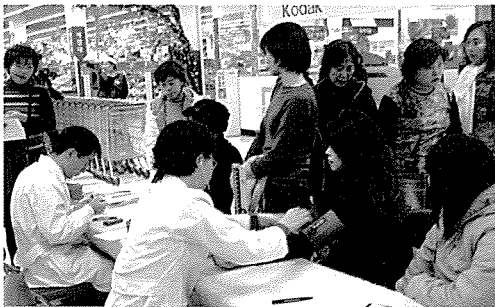
▲ 대전·충남지부는 기초생활보장수급자, 일반주민 등 300여 명에게 무료건강검진을 실시하였다.