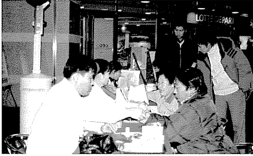
▲ 대구지부는 일반주민, 중식지원학생 등 1,600여 명에게 무료건강검진을 실시하였다.

한국건강관리협회는 봉사과 희생을 실천하고 있습니다. 지난 12월 한달 동안에도 1만 6백 3십여 명에게 무료건강검진과 건강상담을 실시하여 아름다운 만남을 실천하였습니다.