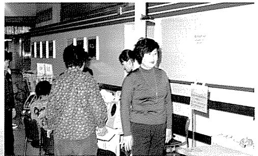
▲ 경북지부는 기초생활보장수급자, 오·벽지 주민 등 200여 명에게 무료건강검진을 실시하였다.