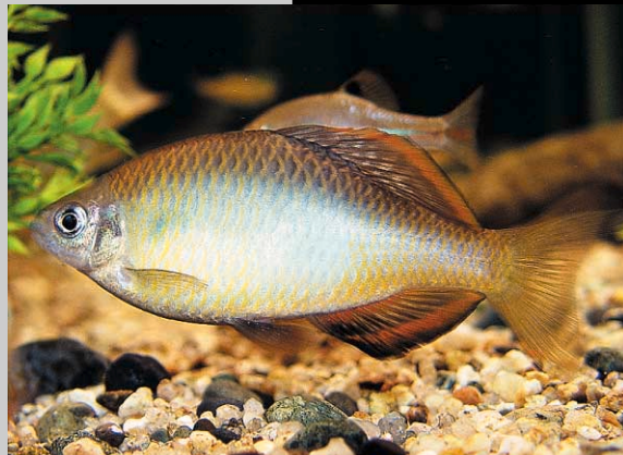
칼납자루 Acheilognathus koreensis