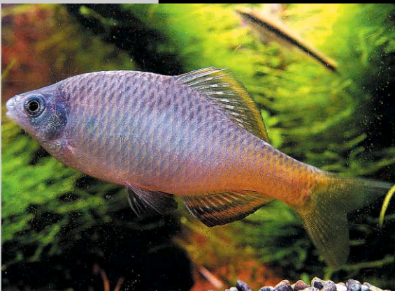
임실납자루 Acheilognathus somjinensis