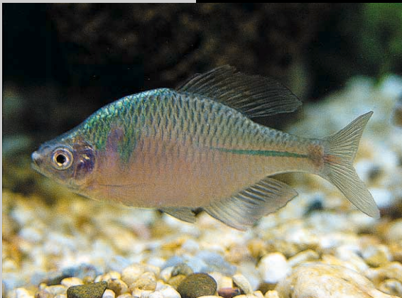
흰줄납줄개 Rhodeus ocellatus