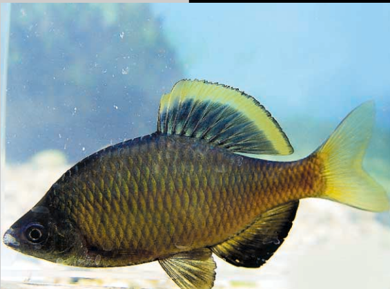
목납자루 Acheilognathus signifer