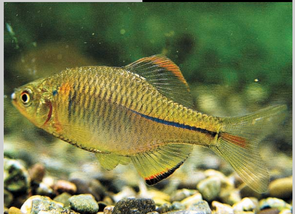
각시붕어 Rhodeus uyekii