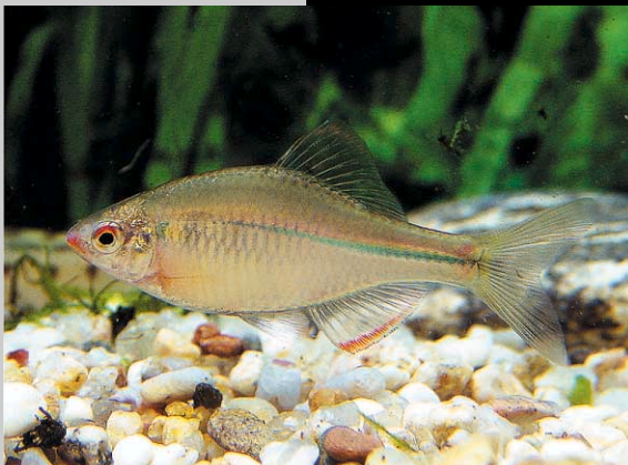
떡납줄갱이 Rhodeus notatus