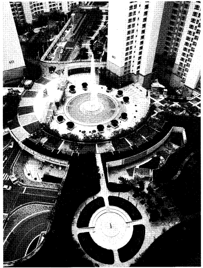
분당 파크뷰내 조경

the# 아파트는 개개인의 독특한 개성이 중시되는 사회변화에 발맞춰 변화하는 라이프 스타일을 수용할 수 있는 새로운 개념의 평면과 차별화 된 인테리어 디자인을 지속적으로 개발해 '살수록 가치를 느끼는 명품 아파트'라는 이미지를 추구하고 있다.