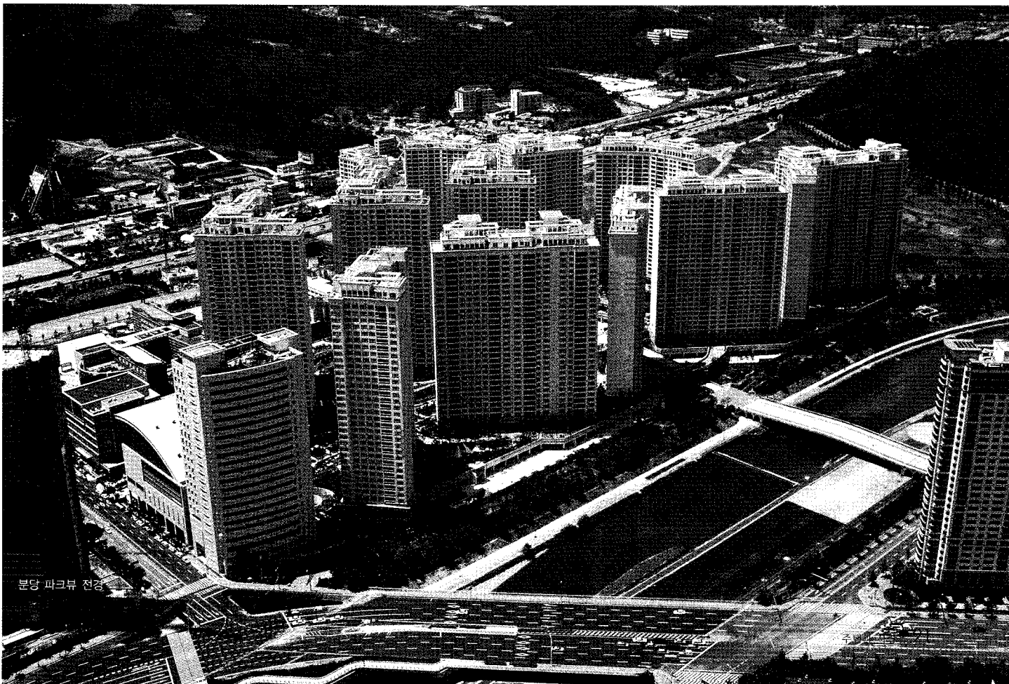
분당 파크뷰 전경

the#은 보이지 않는 부분까지 세심한 사공이 중요하며, 포스코건설이 짓는 아파트는 적어도 3대까지는 살 수 있어야 한다는 철학과 과학적인 설계가 밑바탕이 되어있다. 또한 기존의 공동주택에서 간과할 수 있는 작은 공간에서부터 크기는 배치에 이르기까지 편리성, 실용성, 안정성을 개선하여 주거환경의 질적 향상은 물론 심리적 욕구까지도 충족시킨 인간중심의 주거공간을 지향하고 있다.