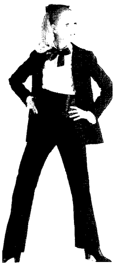
Fig. 1. Yves Saint Laurent, 1966 (L'Officiel, 2002. 4)

<Fig. 3> 역시 우아한 여성의 이미지 대신 미소년과 같은 보이쉬한 스타일로 표현된 턱시도 룩이다.