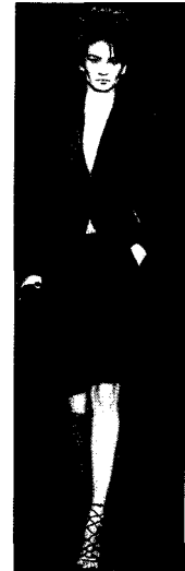
Fig. 8. YSL Rive Gauche 2002 F/W (L'Officiel, 2002. 5)

게 화려하거나 여성스러운 분위기를 나타낼 수 있는 이브닝 웨어의 관능적 분위기 또한 약화시키는 역할을 하여 더욱 세련된 느낌을 전달한다.