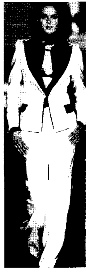
Fig. 2. Roberto Cavalli 2005 F/W (W Korea, 2005. 12)