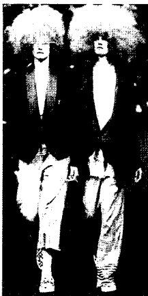
Fig. 13. Under Cover, 2004 S/S (Harper's Barzaa, 2003.12)

첫째, 해체주의 시기에 해당하는 현대사회의 문화에서는 문화적 범주들의 내재적 긴장 또는 양면가치를 억제하지 않고 그대로 표출하기 때문에 패션에 있어서도 남성, 여성이란 성의 하위문화로 나누는 이분