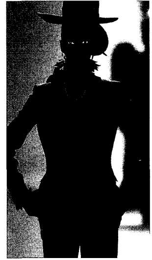
Fig. 4. Victor & Rolf, 2001 F/W (Vogue, 2001. 5)