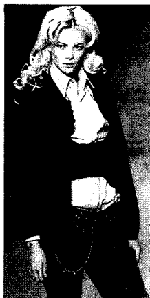
Fig. 14. Dsquared, 2005 F/W (W Korea, 2005.10)