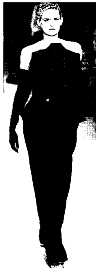
Fig. 10. Jean Paul Gaultier, 2003 S/S Haute Couture (Fashion news, Vol. 84)