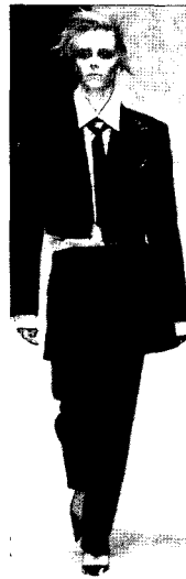
Fig. 11. Jean Paul Gaultier, 2001 FW (Harper's Barzaa, 2001. 5)