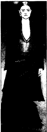
Fig. 9. YSL Rive Gauche, 2001 FW (Vogue, 2001. 5)

또 해체주의는 사물을 분리하고 절단하며 부수고 조각내지만 그 과정을 통해 얻어진 부분들과 조각들은 설득력 있는 원칙 하에 재구성하는 개념으로 <Fig. 11>을 통해서도 확인할 수 있다. 빅 사이즈의 턱시도 재킷의 허리선을 분해한 탈구성적 경향의 장 폴 고티에(Jean Paul Gaultier) 작품으로 과장되고 분해된 재킷의 형태는 정형적인 형태로부터 벗어나 수용자에게 긴장감을 유발시키므로 시선을 집중시키는 하나의 유인자극으로 새로운 조형성을 나타낸다. 또 통일성,