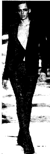
Fig. 6. Gucci, 2004 F/W (L'Officiel, 2002. 8)