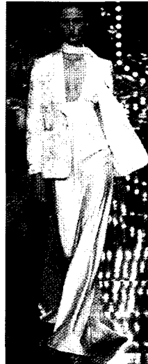
Fig. 7. N Y Industrie, 2002 S/S (Harper's Barzaa, 2001.12)