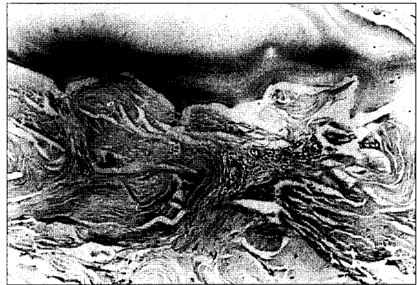
Fig. 2. Histologic slide of the ruptured EPL tendon (Hema-toxylin-eosin stain, × 100). Mucinous degeneration with increase of collagenous connective tissue and lymphocyte infiltration are seen.

환자는 전업 주부로 손을 많이 사용하는 편은 아니었으며, 혈청학적 검사에서 류마티스 인자 음성이었으며, 방사선학적 검사상에서 류마티스 관절염이나 기타 결체조직질환을 의심할 만한 소견은 보이지 않았다. 전신마취 하에서 시험적 절개술을 시행하기로 하였고, 장무지신건의 주행을 따라 절개를 진행하여 제 1중수지(metacarpophalangeal joint) 관절부위에서 파열된 건의 원위부 말단을 찾았고, 근위부로 박리를 진행하여 근-건 이행부의 약 5cm 말단부에서 역시 파열된 건을 발견하였다. 위치상 파열은 Lister절절부위에서 일어난 것으로 추정되었고 건의 양측 단단부는 외견상 석회화가 심한 소견을 보였고, 주위조직의 위축 및 반흔조직이 형성된 소견이 보였다(Fig. 1). 경로를 따라 반흔조직을 완전 절제한 뒤 약 8cm의 결손이 발생하였으며, 수동적으로 무지를 완전 신전시킨 상태에서 동측의 장장근(palmaris longus tendon)을 채취하여 건의 단면적이 파열된 장무지신건의 단단부와 거의 일치함을 확인하고 인장강도도 충분함을 확인한 뒤 양측의 단단 문합(변형 Kessler법)을 이용한 건이식을 시행한 후 창상을 봉합하고 고정은 이식건의 긴장을 감소시키기 위해 수근절(wrist joint)는 30-40° 신전, 모지는 완전히 신전-외전(extension-abduction)상태에서 부목으로 고정하고 상지를 거상시켰다. 건의 양측 단단부는 탈석회화를 시킨 후 시행한 조직학적 검사에서 다발성으로 유점액변성 소견을 보이고 있었고 건 주변에 교원성 섬유와 섬유모세포의 증가소견을 보였다. 또한 국소적으로 만성 비특이성