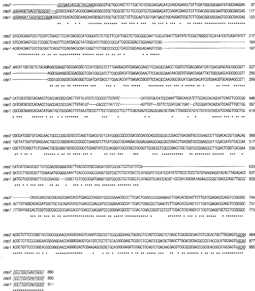
Fig. 3. Amplified nucleotide sequence alignment of T. versicolor KN9522 cmp1 , cmp2 and cmp5 gene fragments with degenerate PCR primers. The degenerate PCR primer sequences were underlined.

NCBI의 Blast-2 염기서열 검색 프로그램을 통해 cmp1 , cmp2