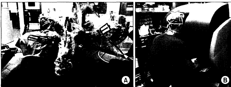
Fig. 2. (A) Set-up of a da Vinci camera and two robotic arms. (B) Surgeon console.