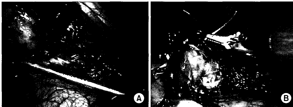
Fig. 3. (A) Tissue dissection was done with a Cadiere forceps and hook electrocautery. (B) Lung parenchyma was repaired with a continuous suture using EndoWrist needle drivers.

게 세 부분으로 구성되어 있는데, 첫째, 로봇팔(robotic arms) 부분으로서 네 개의 로봇 팔이 장착되어 있으며, 둘째, 외과의사가 앉아서 조작을 하게 되는 외과의사 작업대(surgeon console), 셋째, 로봇팔과 외과의사 작업대 간을 연결하는 통합조절카트(integrative control cart)로 이루어져 있다. 술자는 인체공학적으로 설계된 외과의사 작업대에 앉아서 팔꿈치를 지지대에 올려놓고 컴퓨터가 제어하는 운동크기조절(motion scaling)제어 시스템의 도움을 받아 자연적으로 발생하는 미세한 손떨림(natural tremor)을 제